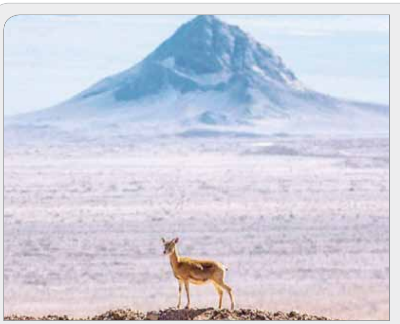
احساس امنیت «میش جوان» بر تلی از باطله / حیات وحش معدن مهدی‌آباد / ۱۴ بهمن ۹۶

هدف از راه‌اندازی فاز نخست پروژه معدن مهدی‌آباد، تولید ۲۰۰ هزار تن کنسانتره روی است. کرباسیان یادآور شد: با آغاز تولید محصول