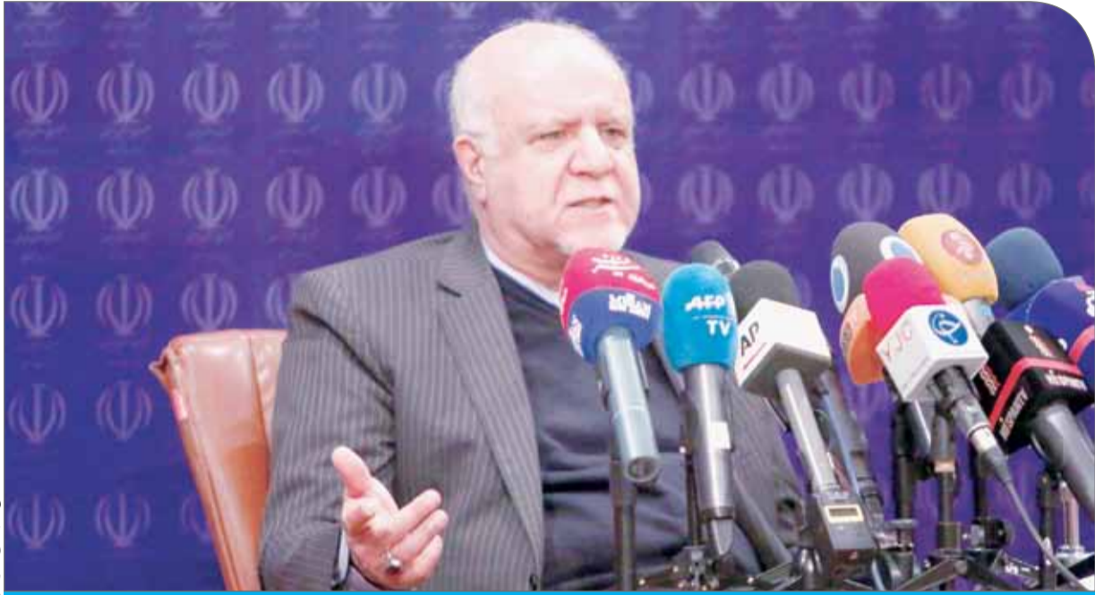
تکمن مهدی کاروبی

بیژن نامدار زنگنه در نشست خبری روز گذشته که در محل وزارت نفت برگزار شد، گزارشی از عملکرد زیرمجموعه‌های صنعت نفت ارائه کرد و به پرسش‌های خبرنگاران در این حوزه‌ها پاسخ داد.