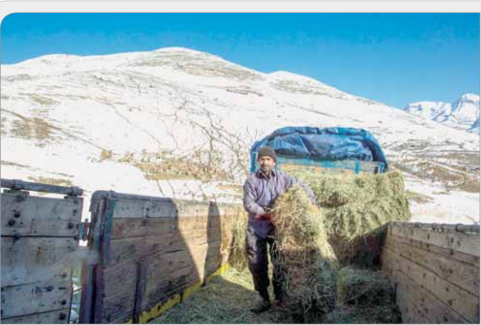
تهیه علوفه از سوی خیرین برای حیوانات کوهستانی که به دامنه‌ها پناه آورده‌اند