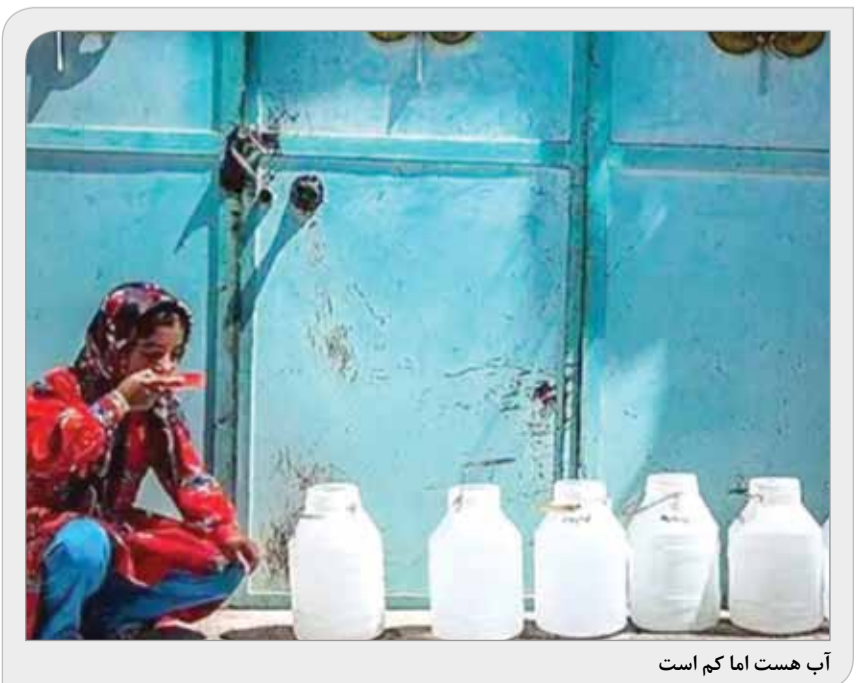
آب هست اما کم است

«کار پول سیاه در زمان ناصرالدین‌شاه به جایی کشید که جبار زند ۸۰ عدد، یک قران. دو روز بعد کامران میرزا مجلس کرد که آن جار مضر بود یا مفید؟ ملک‌التجار گفت خوب بود جار را بعد از این مجلس امر می‌فرمودید بکشند.» ما عادت کرده‌ایم تصمیم‌هایی شتابزده و نسنجیده بگیریم و هنگامی که نتایج مخرب آن تصمیم‌ها نمایان شد، به فکر چاره برآییم. سیاست جدید ارزی دولت نمونه‌ای از این شیوه تصمیم‌گیری است. درست است که در شرایطی که نرخ دلار هر روز جهش تازه‌ای را تجربه می‌کرد و اقتصاد کشور را به تهایی خطرناک کشانده بود، دولت چاره‌ای نداشت جز آنکه «کاری بکند»، اما کاری که دولت انجام داد، گرچه برای چند روزی التهاب‌ها را کم کرد، اما آشکارا نسنجیده و غیرقابل‌دوام بود. نیازی نیست که شیفته بازار آزاد باشیم و کاستی‌های آن را انکار کنیم تا به انگیزه طرفداران مداخله دولت در کنترل «نرخ توافقی» مشکوک شویم. کمترین انتظار این است که پیش از گرفتن هر تصمیمی، با خبرگان بخش خصوصی، کارشناسان و صاحب‌نظران اقتصادی مشورت و استدلال‌های آنها شنیده شود. اقتصاد نیوز