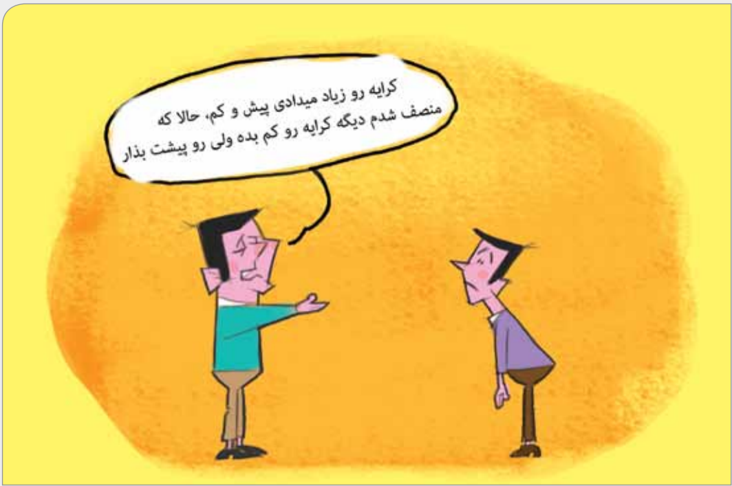
مطبوعات: صاحبخانه‌ها منصفانه نرخ اجاره را تعیین کنند طرح: حسین علیزاده