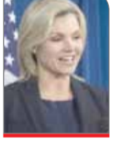
سخنگوی وزارت امور خارجه امریکا

تایید کرد هدف این کشور کاهش صادرات نفت ایران است و برای این هدف مذاکراتی با دولت چین انجام می‌دهد. به گزارش ایسنا هیتز ناووتر، سخنگوی وزارت امور خارجه امریکا در نشست خبری خود از پاسخ به پرسشی درباره توییت دونالد ترامپ، رییس‌جمهوری امریکا مبنی بر اینکه دولت اوایلما در جریان مذاکرات هسته‌ای با ایران به ۲۵۰۰ ایرانی حق شهروندی اعطا کرده، سر باز زد و این مسئله را به یک وزارتخانه دیگر ارجاع داد.