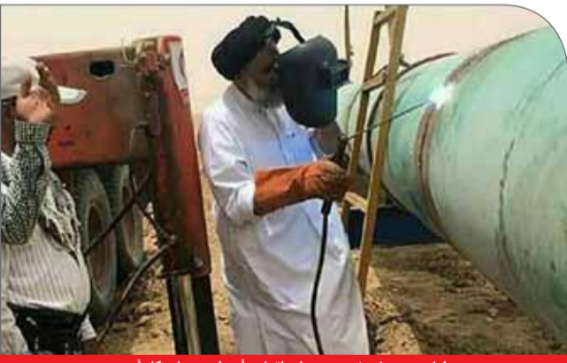
امام جمعه خرمشهر هم برای اتمام «آب غدیر» پای کار آمد