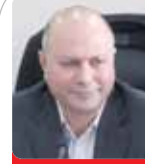
بهرام شکوری رئیس کمیسیون معادن اتاق ایران