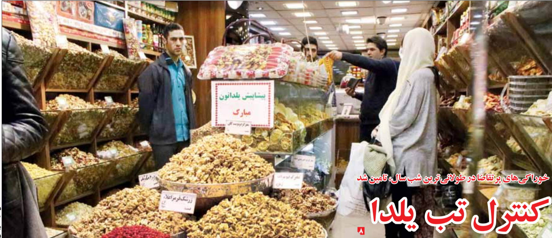
خوراکی‌های پر تقاضا در طولانی‌ترین شب سال، تامین شد

چهارمین همایش سالانه مبارزه با فساد با حضور نمایندگان بخش خصوصی، نمایندگان تشکل‌های مردم‌نهاد و مسئولان دولتی و سازمان ملل متحد برگزار شد. در این همایش سالانه که مهمانانی از نهادهای معتبر مانند دفتر مقابله با مواد مخدر و جرم