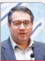
وزیر صنعت، معدن و تجارت با بیان اینکه از امروز، کار برگزاری آیین روز ملی صادرات را به اتاق بازرگانی ایران واگذار می‌کنیم، تأکید کرد: باید تیراژ تولید را افزایش داد و زیرساخت‌ها را ایجاد کرد.

وزیر صنعت، معدن و تجارت با بیان اینکه از امروز، کار برگزاری آیین روز ملی صادرات را به اتاق بازرگانی ایران واگذار می‌کنیم، تأکید کرد: باید تیراژ تولید را افزایش داد و زیرساخت‌ها را ایجاد کرد. رضا رحمانی گفت: ایام روز ملی صادرات، دهه آخر ماه صفر بود و برخی درخواست داشتند که این آیین به بعد از این ماه منتقل شود؛ اما دلیل مهم این بود که شخصاً به سازمان توسعه تجارت ایران اعلام کرده بودم که اتاق بازرگانی باید متولی برگزاری روز ملی صادرات شود، همانطور که روز صنعت و معدن نیز از سوی خانه صنعت و معدن برگزار می‌شود؛ پس احساس