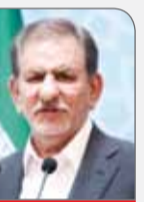
معاون اول رئیس‌جمهوری با بیان اینکه دشمن نتوانست صادرات نفت ایران را صفر کند، گفت: همچنان در حال فروش نفت هستیم. اسحاق جهانگیری گفت: هر فردی که امروز برای کشور صادرات انجام می‌دهد، انسان شریفی است که خوب تشخیص داده که در این مقطع، نیاز کشور کجاست و باید به چه کاری بپردازد و بهتر بود که این تحلیل، در روز ملی صادرات که در تقویم رسمی کشور ثبت شده، انجام می‌شد اما اصل پرداخت به صادرات جزو مهم‌ترین مسائلی است که باید مورد توجه قرار گیرد. وی تأکید کرد: در معیشت مردم باید کار جدی‌تر کنیم، چرا که ملت ایران به‌ویژه طبقات ضعیف با صبر و تحمل فشارها و سختی‌ها، این روزها را پشت‌سر گذاشتند و حاضر نشدند کمترین حرکتی که نشان دهد کشور و نظام آنها در خطر است، از خود نشان دهند و مردم با سبیلی صورت خود را سرخ نگاه داشته‌اند و باید تلاش کرد و برای این بخش هم راهکار ارائه داد.

انتخابات پیش رو است و باید شرایطی را به وجود آورد که همه مردم احساس کنند که در بین کاندیداها، کاندیدای مورد نظرشان وجود دارد؛ پس مشارکت در انتخابات آتی، منافع ملی کشور را تثبیت خواهد کرد. امیدواریم همه این مسیر را طی کنیم. امریکایی‌ها به مرحله‌ای رسیده‌اند که بانک مرکزی ایران را به دلیل مسائل هسته‌ای، تحریم کردند و در کنار آن، دوباره این بانک را تحت لوای مبارزه با تروریسم، تحت تحریم قرار دادند. بر این اساس مقامات ارشد کشور از رهبر معظم انقلاب تا وزیر امور خارجه گرفته تا شرکت‌ها را هم در فهرست تحریم قرار داده‌اند و تمام زمینه‌های اقتصادی را تحریم کردند. جهانگیری گفت: دشمن نتوانسته صادرات نفت خام کشور را به صفر برساند؛ اما تحت فشاری که وارد شد، حتی کشورهای دوست ایران هم که تا به حال جزو نزدیک‌ترین کشورهای باره ما هستند، جرأت اینکه نفت ایران را خریداری کنند، ندارند و ماهه روش‌های دیگری متوسل می‌شویم تا بتوانیم نفت کشور را بفروشیم.