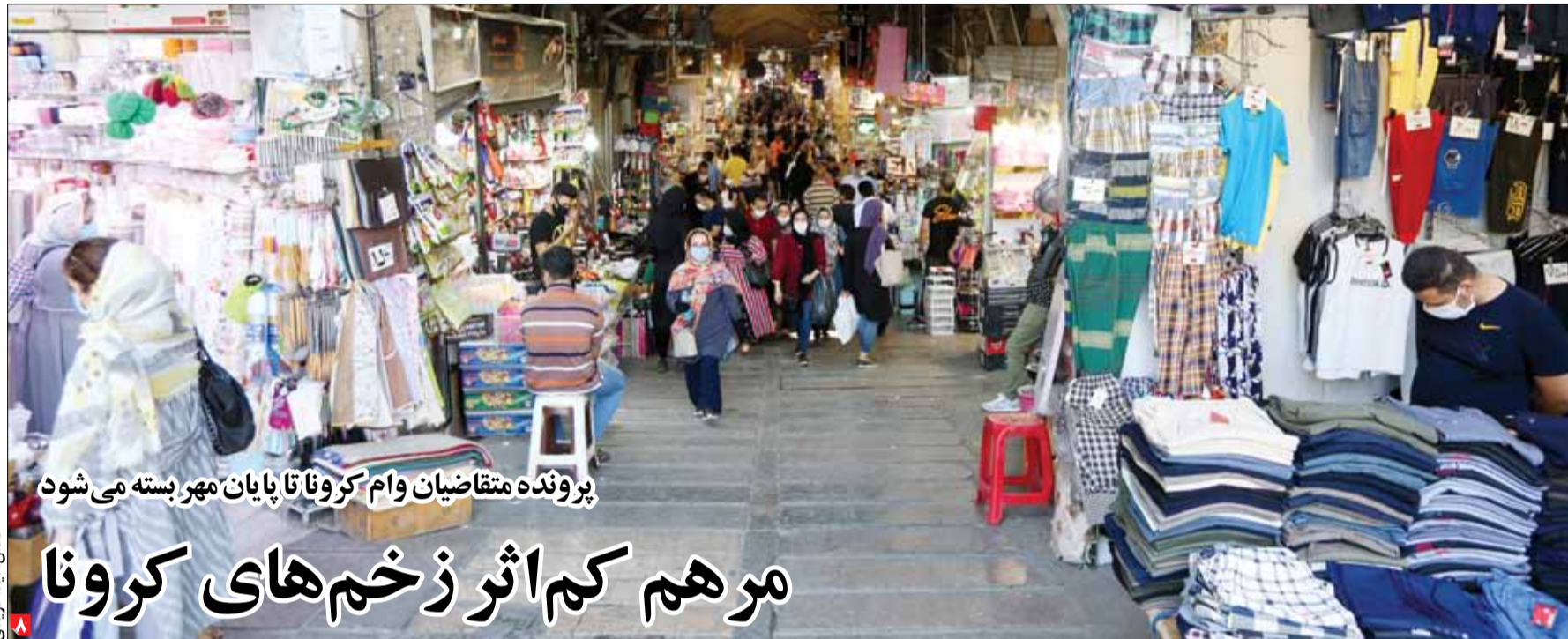
پرونده متقاضیان وام کرونا تا پایان مهر بسته می‌شود

در مرداد ۱۳۹۷ نمایندگان دوره یازدهم مجلس شورای اسلامی درباره اصلاح قانون چک به نتایج رسیدند که با اکثریت آرا نیز به تصویب رسیده، اما تا امروز برخی از مواردی که باید طبق زمانبندی این اصلاحیه به اجرا درمی‌آید هنوز کان‌لم‌یکن باقی مانده‌اند. برای مثال بند عدم وصول چک‌هایی که در وجه حامل صادر شده‌اند یکی از مواردی است که