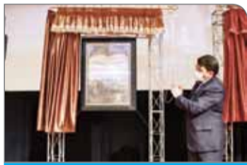
کشاوری مصرف می‌شود.