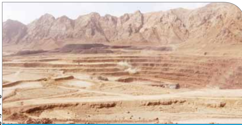
در چهل و دومین سالگرد پیروزی انقلاب رقم خورد

رسیدن به ۴۷۶ میلیون تن ۱۱۶۵ درصد، آهن اسفنجی با دستیابی به ۳۵۳ میلیون تن نزدیک ۸۰ درصد و فولاد خام با رسیدن به ۲۷۵ میلیون تن ۶۶۶ درصد رشد کرده است. همچنین ظرفیت تولید کنسانتره مس با رسیدن به یک میلیون و ۱۵۰ هزار تن ۳۵ درصد و کاتد مس با دستیابی به ۴۵۷ هزار تن ۷۷ درصد رشد داشته است. ظرفیت تولید آلومینا بدون تغییر ۲۴۵ هزار تن است اما ظرفیت تولید آلومینیوم با رشد نزدیک ۸۰ درصدی به ۷۷۰ هزار تن رسیده است.