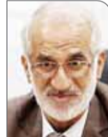
اداری است که به این بخش ضربه می‌زند. شیخی راهکار عملی برای گذر از این بحران در شرایط کنونی را تمرکز بر صادرات دانست و در این باره تصریح کرد: در هر حال صادرات در کشور زمانی می‌تواند شکوفا شود که تولید و جهش تولید به ثمر بنشیند و تولیدات داخلی با ایجاد

بروز این مشکل فرآیند طولانی بروکراسی اداری در حوزه تجارت کشور است و متغیرهای مؤثر در این رتبه‌بندی عموماً تحت تاثیر منفی بروکراسی‌های اداری هستند. وی در ادامه افزود: می‌توان نقش همین مشکل را در گزارش فضای کسب‌وکار کشور در گزارش سالانه بانک جهانی نیز مشاهده کرد. شیخی بروکراسی اداری را