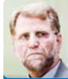
مردنقی عزتی اقتصاددان