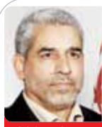
صادق خلیلیان وزیر اسبق جهاد کشاورزی

براساس معیار توسعه انسانی سازمان ملل، کشور ایران از یک کشور با سطح توسعه پایین با عدد ۵۱.۲ درصد در زمان پهلوی، به یک کشور با سطح توسعه بالا با عدد ۷۹.۷ درصد، در دهه چهارم انقلاب ارتقا یافته است.