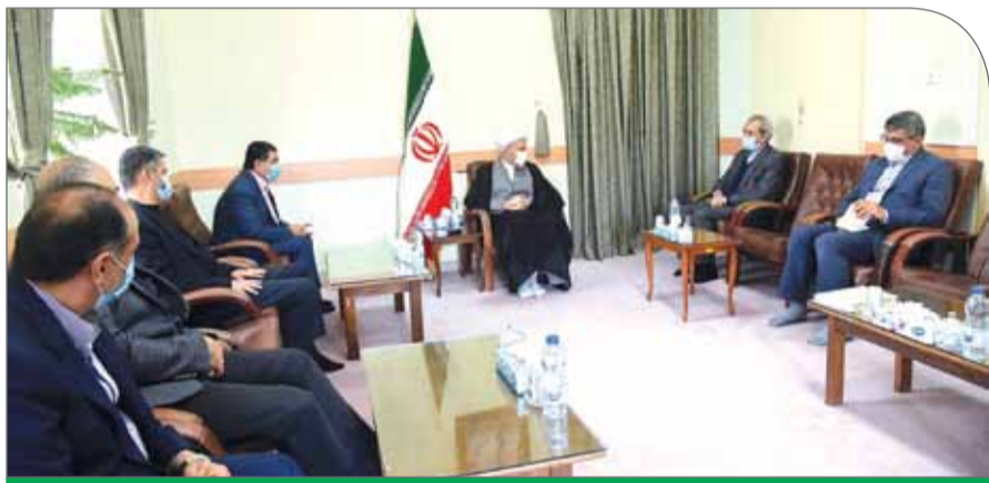
کشور در تهران اداره نمی شود بلکه به ویژه در حوزه اقتصاد، استان ها آن را اداره می کنند اما متاسفانه از این ظرفیت قابل توجه استفاده درست نمی شود

دیدار رئیس اتاق بازرگانی ایران با آیت الله دزکام، نماینده ولی فقیه در فارس و امام جمعه شیراز برگزار شد. در این دیدار رئیس اتاق بازرگانی ایران تأکید کرد: با بررسی عادلانه دولت ها پس از انقلاب تاکنون هیچ دولتی به اندازه دولت سیزدهم با مشکلات و مسائل متعدد روبه رو نبوده است. مشکلاتی مانند تحریم ها، مسائل اقتصادی و معیشت مردم، خشکسالی و مسائل متعدد کشور بار سنگینی را بر دوش دولت گذاشته که هر کدام از این مسائل طلب می کند حرکت کشور متفاوت با گذشته باشد.