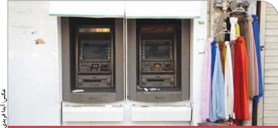
عکس: آیدیا خبریدی