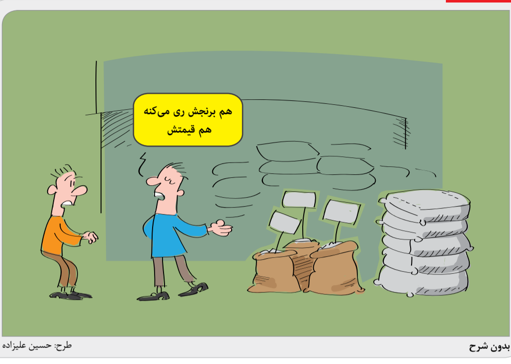
طرح: حسین علیزاده