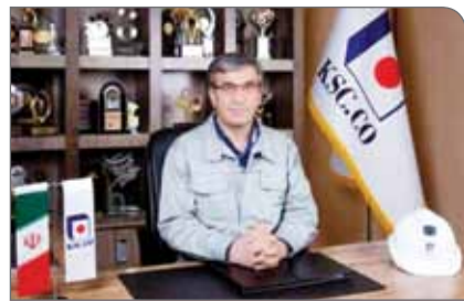
پیشینه کاری خود دارد.

در مجموع افزایش جمعیت تأثیر مستقیمی بر محیط‌زیست دارد و این مسئله زمانی حادتر می‌شود که شرایط می‌شستی و رفاهی مناسب از جامعه سلب شده و بر اثر آن، بهره‌برداری اقتصادی از محیط‌زیست و وابستگی اقشار ضعیف جامعه به منابع طبیعی بیشتر می‌شود.