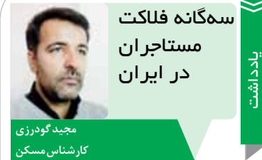
سه‌گانه فلاکت مستاجران در ایران