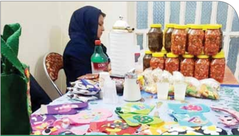
نقش مشاغل خانگی در توسعه اقتصادی به عنوان یک فعالیت کار آفرینانه اثبات شده است

درگاه ملی مجوزهای کسب و کارهای کشور، از شهریور ۱۳۹۹ با هدف ارائه مجوز راه اندازی کسب و کار در کشور راه اندازی شد. به گفته بسیاری از مسئولان و مدافعان این طرح، درگاه ملی مجوزهای کشور باعث تسهیل صدور مجوزهای کسب و کار، شفافیت، عدالت و حذف مقررات دست و پاگیر شده است. بسیاری بر این باورند که با تسهیل صدور مجوزها و توسعه دولت الکترونیک بسیاری از مجزاهای فساد بسته خواهد شد. همچنین در صورت راه اندازی کامل این موضوع و اتصال و تبادل داده تمامی دستگاههای اجرایی کشور، با نظارت نهادهای بر یکدیگر و دسترسی و شفافیت برای عموم دیگر جایی برای امضاهای طلایی و فساد باقی نمی ماند. با این همه برخی از دستگاهها تاکنون به درگاه ملی مجوزها متصل نشده اند که به گفته دولتی ها و نمایندگان مجلس باید فرآیند اتصال به درگاه ملی مجوز را سریع تر شروع کنند. رئیس مجلس شورای اسلامی نیز چندی پیش با تاکید بر ضرورت اجرای قانون تسهیل صدور مجوز کسب و کار گفت: دستگاههای ذی ربط تا آبان ماه فرصت دارند تا به درگاه مذکور متصل شوند. از سوی دیگر ظرفیت های اقتصادی کشور برای ایجاد اشتغال، کاهش نرخ بیکاری و بهبود وضعیت معیشتی مردم جامعه سال هاست که مدنظر مسئولان قرار دارد. بنابراین در این گزارش به نقش راه اندازی این درگاه در تسهیل صدور مجوز مشاغل خانگی پرداخته است.