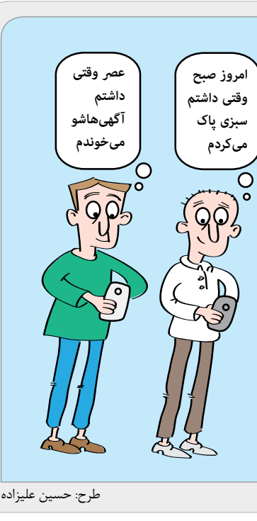
طرح: حسین علیزاده