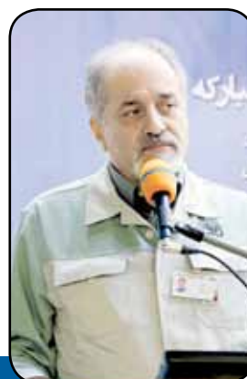
بزرگترین دستاوردهای فولاد مبارکه در سال ۹۶