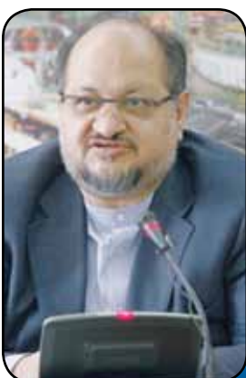
ایمیدرو؛ یک گام جلوتر از اهداف تعیین شده سال ۹۶