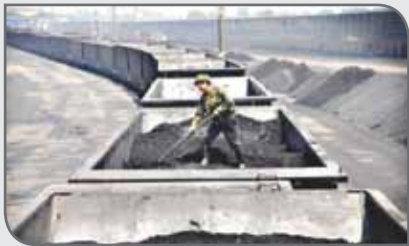
استرالیا بزرگ‌ترین تولیدکننده زغال سنگ در جهان است و چین با واردات ۳۰ درصد از تولیدات این کشور دومین بازار بزرگ زغال سنگ استرالیا به شمار می‌رود.

در ادامه اختلاس در شرکت بزرگ هوآوی، چین واردات زغال سنگ از استرالیا را محدود کرد و حضور زغال سنگ استرالیا در دومین بازار بزرگ خود را در حاله‌ای از ابهام قرار داد. به گزارش فارس به نقل از راشاتودی، یکی از بزرگ‌ترین بنادر چین ورود زغال سنگ از استرالیا را محدود کرد. چین دومین بازار بزرگ زغال سنگ برای استرالیا است و هم‌اکنون بندر دالیان چین واردات زغال سنگ از استرالیا را برای سال جاری میلادی حداکثر ۱۲ میلیون تن تعیین کرده است که