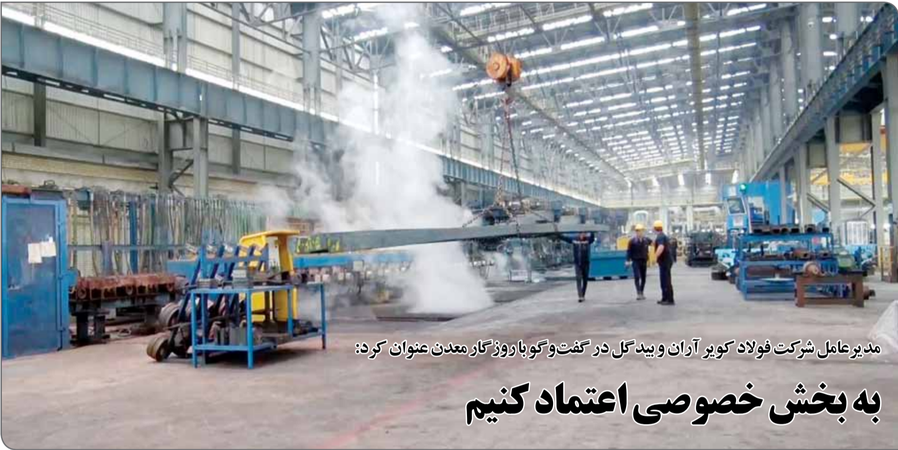
مدیرعامل شرکت فولاد کویر آران و بیدگل در گفت‌وگو با روزگار معدن عنوان کرد:

ورود فولاد به بورس کالا مزیت عمده داشت و آن نزدیک شدن قیمت‌ها به حاشیه بازار و انتقال سود از واسطه‌ها به تولید و نیز انگیزه برای ورود بخش خصوصی به صنعت فولاد کشور بود. بهرام سجانی، رئیس انجمن تولیدکنندگان فولاد ایران درباره نقش بورس کالا در توسعه صنعت فولاد عنوان کرد: قبل از راه‌اندازی بورس کالا در شهریور سال ۸۲ فولاد مشمول قیمت‌گذاری از طریق وزارت بازرگانی بود که این امر تفاوت نرخ قابل‌توجهی را میان نرخ در کارخانه (قیمت‌گذاری شده از سوی وزارت بازرگانی) و قیمت‌های کف بازار ایجاد کرد.