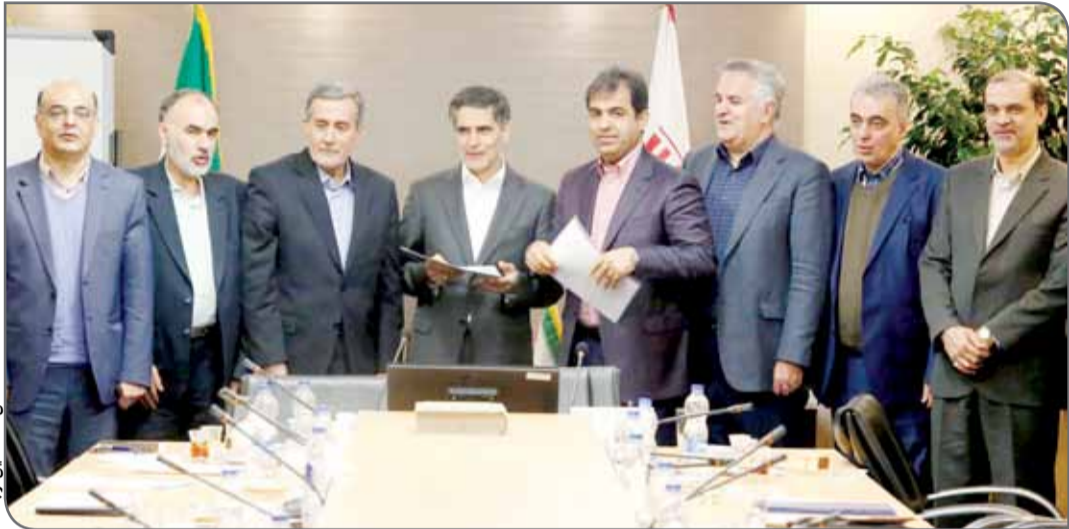
عکس: ها، حسین از چند

آینده‌پژوهی بوده و در راستای نقشه راه معدن و صنایع معدنی است.