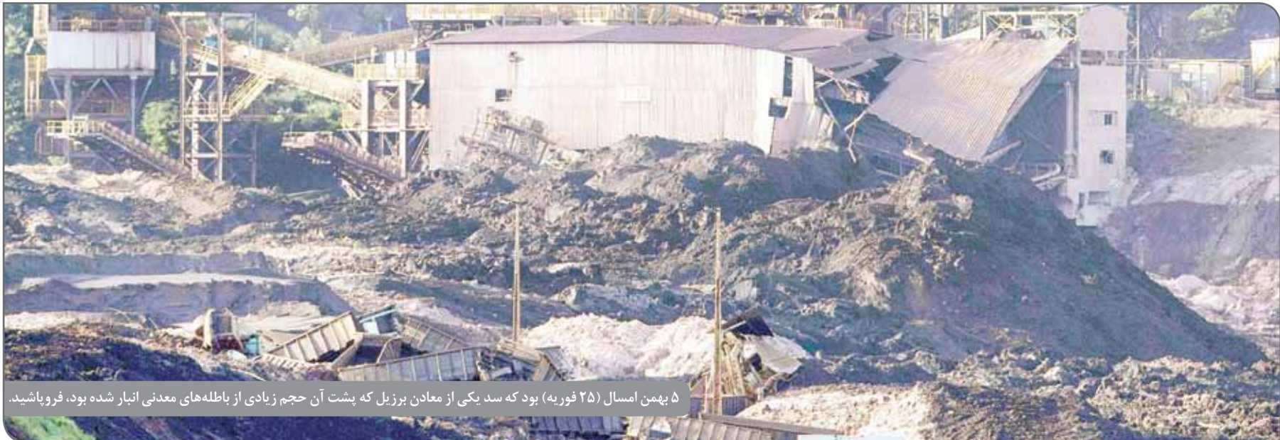
۵ بهمن امسال (۲۵ فوریه) بود که سد یکی از معادن برزیل که پشت آن حجم زیادی از باطله‌های معدنی انبار شده بود، فروپاشید.

کرد و در بدو ورود به محله انگلیسی اکونومیست گفت: پرو کشوری معدنی است اما باید همه چیز را متفاوت از گذشته انجام دهیم. معدنکاری نقش کلیدی در پرو ایفا می‌کند و اقتصاد این کشور به معدن گره خورده اما پرویی‌ها در کنار بهره‌مندی از توسعه ذخایر معدنی خود از آن آسیب نیز دیده‌اند و ضعف نظارت بر استخراج مواد معدنی، عامل ناآرامی‌های اجتماعی و تخریب محیط‌زیست در این کشور شده است؛ رویه‌ای که رئیس‌جمهوری جدید پرو وعده تغییر آن را داده است. او می‌گوید به دنبال توسعه بیشتر بخش معدن در کشور است و در همان حال می‌خواهد آثار آنچه را «معدنکاری زشت» نام گرفته، از این کشور بردارد، هر چند تاکنون و پس از گذشت یک سال اقدام چشمگیری از سوی دولت او مخابره نشده است.