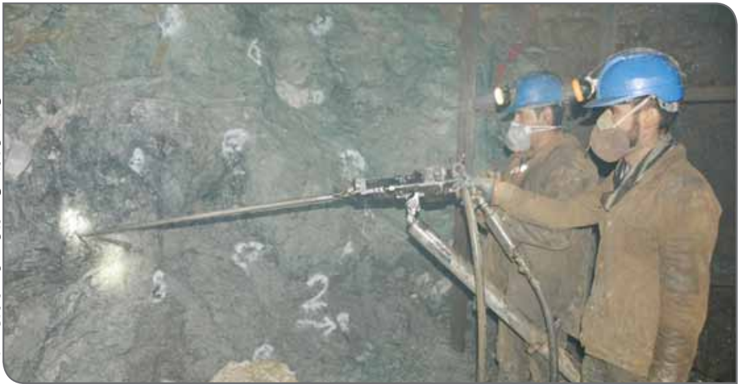
نمایی از معدن زیرزمینی انگوران