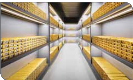
محدود خواهد کرد، برآوردهای بلندمدت از تولید جهانی چندان مثبت نیست.

اونس که بالاترین رکورد در ۲۶ سال گذشته است، خواهد رسید. یکی از دلایل افت تولید استرالیا، پایان عمر برخی از معادن بزرگ در این کشور است.