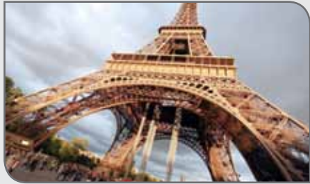
«گوستاو ایفل»، طراح برج ایفل، از کیفیت آن ابراز شگفتی کرد و در نتیجه، ده‌ها تن از معادن الجزایر استخراج و به فرانسه منتقل شد تا از آنها برای ساخت برج ایفل استفاده شود.

آنیل آگاروال از سال ۱۳۸۲ خورشیدی (۲۰۰۳ میلادی) تا ۱۳۸۴ خورشیدی (۲۰۰۵ میلادی) مدیرعامل شرکت منابع ودانتا بود. آگاروال ازدواج کرده، دو فرزند دارد و درحال حاضر ساکن شهر لندن در انگلیس است. او در سال ۱۳۸۶ خورشیدی (۲۰۰۷ میلادی) یک میلیون دلار به دانشگاه ودانتا در اورپسا در شرق هند کمک مالی کرده است.