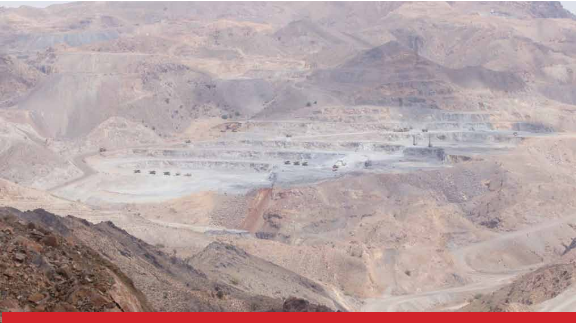
نمای هوایی از معدن سیران در استان کرمان.