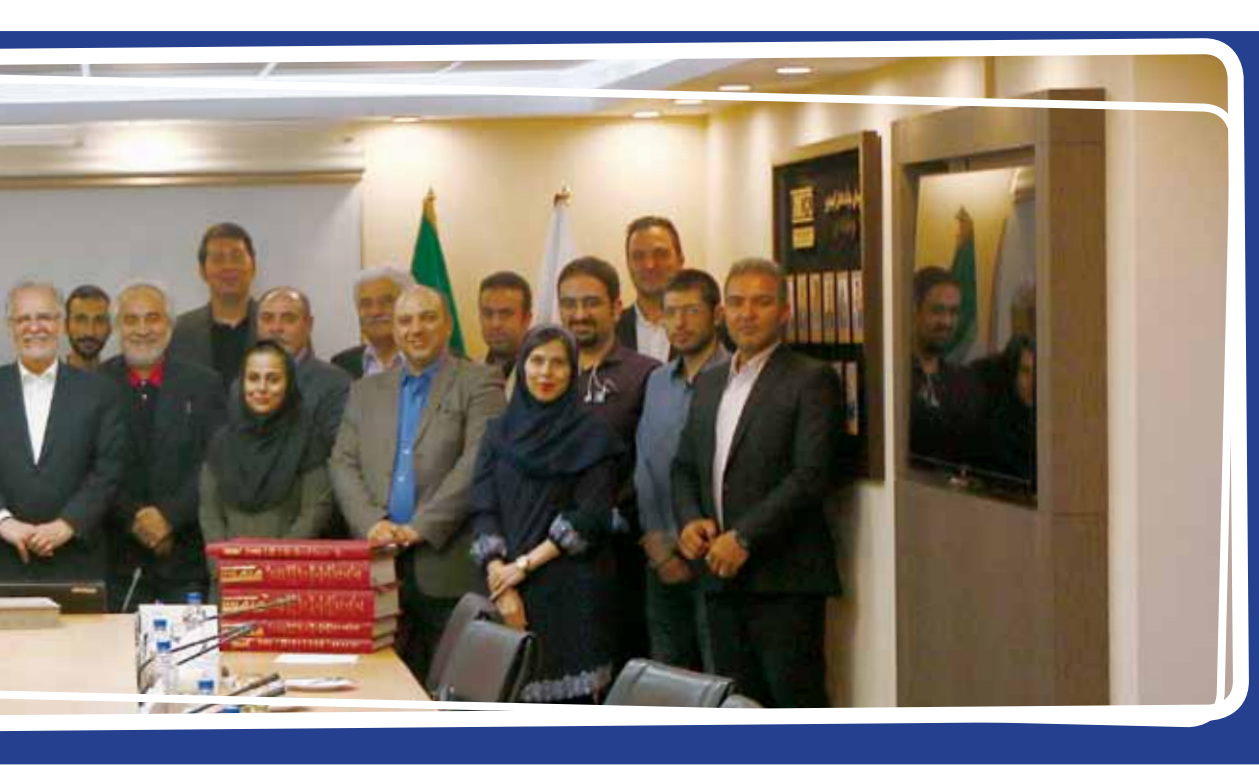
معاون وزیر صنعت، معدن و تجارت در دیدار با اعضای تحریریه روزنامه صمت

معاون وزیر صنعت، معدن و تجارت در ادامه افزود: با توجه به پیشرفت طرح‌های فولادی تاکنون، پیش‌بینی می‌کنیم به تولید حدود ۴۰ میلیون تن تولید فولاد در سال ۱۴۰۰ برسیم و رسیدن به ۵۵ میلیون تن نیز عملی است. وی تصریح کرد: می‌گویید سرمایه‌گذاری در این زمینه دست بهتر از ایجاد ظرفیت فولاد تا ۵۵ میلیون تن است. در این زمینه باید بپذیریم ایران دو شانس بزرگ به نام سنگ آهن و گاز دارد که برای ما ارزش افزوده و اشتغال ایجاد می‌کند. تفاوت معدن با صنایع این است که به ریشه ایجادشتر می‌شود. از این دو چشم‌انداز این بخش روشن است و خاک کشور محدود است که فقط برای کشورهای کمی مهیسا بوده و از چنین موهبت الهی برخوردار ند؛ در دست مانند کشورهای نفت‌خیزی که تعدادشان در جهان بسیار محدود است اما تمام کشورها به نفت و گاز وابسته‌اند. ضمن اینکه منابع خدادادی تجدیدناپذیرند. وقتی سنگ آهن وارد فولاد به کار می‌برد می‌توانید فولاد آن را بازیافت کرده و از آن دوباره فولاد تولید کنید اما نمی‌توانید آن را به سنگ آهن بازگردانید. میلیون‌ها سال طول می‌کشد تا کیلومترشتر را آزاد اعلام کردیم و به سازمان‌های صنعت، معدن و تجارت استان‌ها پس دادیم چون احساس کردیم در حوزه کاری ما نیست اما سازمان‌های استان‌ها می‌توانند این محدوده‌ها را به بخش خصوصی واگذار کنند.