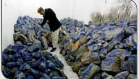
نیز از امضای قرارداد استخراج معدن این کشور با شرکت‌های امریکایی و انگلیسی ابراز نگرانی کرده و آن را تاراج و دزدی قانونی معدن این کشور عنوان کرده است.

طالبان، مقامات دولت افغانستان را به زمین‌خواری، رشوه و استفاده از امکانات دولتی برای منافع شخصی متهم کرده است. بر اساس این بیانیه، منابع طبیعی و معدن افغانستان، سرمایه‌های ملی هستند که آرزوی توسعه اقتصادی، بازسازی و پیشرفت کشور و مردم به آنها وابسته است. در پایان بیانیه تأکید شده است که استخراج معدن باید شفاف و علنی باشد اما دولت افغانستان با معامله‌های پنهانی، سرمایه مردم را در اختیار نیروهای خارجی قرار می‌دهد. این در حالی است که شبکه نظارت بر منابع طبیعی افغانستان