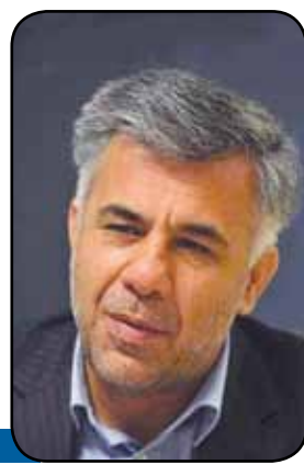
با حکم رئیس جمهوری داریوش اسماعیلی رئیس سازمان نظام مهندسی معدن شد