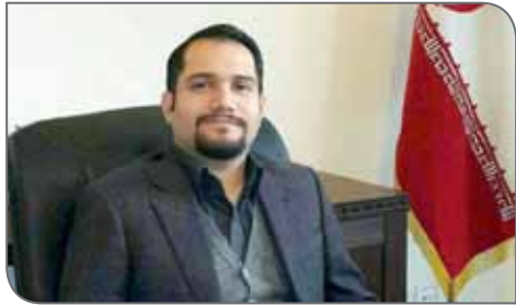
باید با تاثیرپذیری از نگاه‌های کارشناسان بخش معدن به تعامل تبدیل شود.

وی با بیان اینکه خسارت در تولید مانند شبکه عصبی بدن در تمام بخش‌ها رخنه خواهد کرد، گفت: پیشنهاد ما حرکت از آخر به اول است یعنی در گام نخست تعیین میزان «خسارت»، گام دوم تعیین محل «خسارت»، گام سوم تعیین دلیل «خسارت»، گام چهارم مسیر «خسارت»، گام پنجم «آمار و تحلیل» و گام آخر «تاق فکر و تمهید». در صورتی که اتاق فکر شامل مجموعه‌ای از قوه‌های مقننه، اجرایی و قضایی و بازار نباشد، نتیجه مطلوب نمی‌دهد.