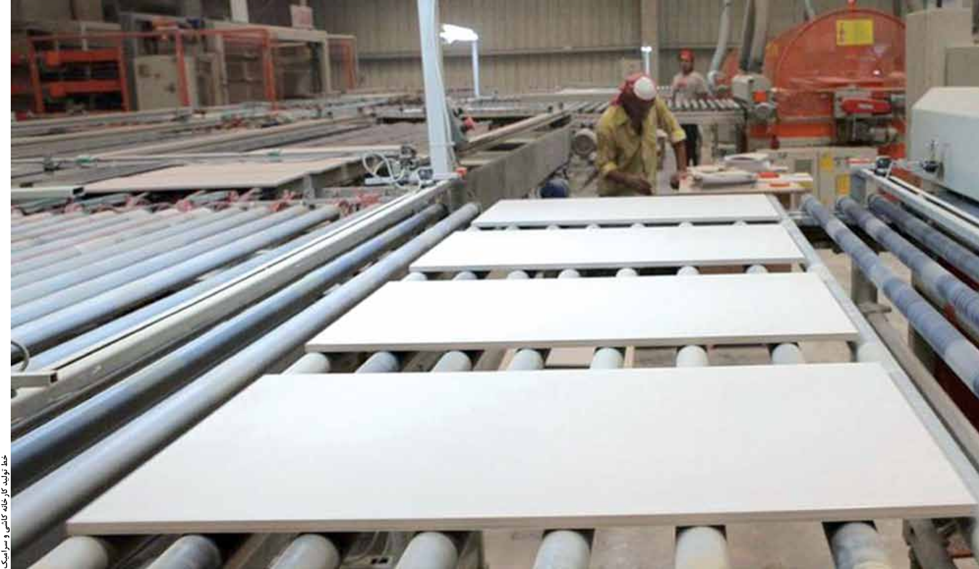
خط تولید کارخانه کاشی و سرامیک

شد در عمل ماشین‌آلات این صنعت بدون استفاده بمانند و از سوی دیگر دیوی سنگینی روی دست تولیدکنندگان باقی بماند.