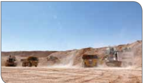
واحدهای ذوب قرار دهنده چون در حال حاضر تولید داخل کاشش یافته و در نتیجه آن، صادرات نیز کم می‌شود.

مهم تلاشی می‌کند. گفتنی است، ایران چهارمین تولیدکننده بزرگ سرب و روی در آسیا پس از چین، قزاقستان و هند است که از نظر تولید شمش روی جایگاه ششم و از نظر تولید سرب جایگاه پنجم را در آسیا دارد. فقط ۳ درصد از ذخایر سرب و روی در مهم‌ترین معادن ایران یعنی مهدی‌آباد و انگوران قرار دارد.