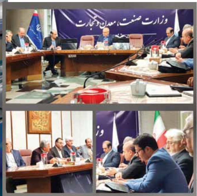
فولاد مبارکه

و شاهد خرید و فروش به بهترین شکل باشیم. دبیر انجمن تولیدکنندگان فولاد ایران همچنین در پاسخ به این پرسش که چرا میزان صادرات فولاد در مهر کاهشی بوده است، عنوان کرد: کاهش صادرات به صورت عمده به مسائلی بروکراتیک بازمی‌گردد. یک موضوع دیگر هم این است که فولاد صادراتی را اشتباه قیمت‌گذاری می‌کنیم و کالای صادراتی را گران‌تر می‌فروشیم تا ارز بیشتری به کشور وارد شود. این سیاست برای صادرکننده صرفه نخواهد داشت و متعهد به یک امر غیرواقعی می‌شود. این موضوع سبب شده که صادرکننده چندان رغبتی برای صادرات نداشته باشد. خلیفه‌سلطان ادامه داد: یک‌سری مقررات روزمره و دست و پاگیر برای صادرکننده در نظر گرفته‌اند که سبب کاهش صادرات می‌شود، در حالی که باید مسیر را به روی صادرکننده باز گذاشت تا صادرات راحت‌تر انجام شود. درحال حاضر خودتحریمی‌ها مشکلات بسیاری را برای ما به همراه آورده‌اند و نباید بیش از این در داخل مشکلات جدیدی برای خود برانسیم و مانع‌تراشی برای صادرات کنیم. وی ادامه داد: یکی از قوانین این است که صادرکننده را متعهد به ارز نیامی کرده‌اند. البته تا اینجا مشکلی وجود ندارد اما باید به همان نرخ در محصولات خود را به فروش می‌رسانند، ارز به نیما بدهند نه با قیمتی بالاتر. این در حالی است که گمرک به صورت آنلاین و روزانه، نرخ‌ها را بر مبنای نرخ جهانی می‌تواند اعلام کند.