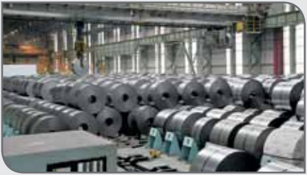
گفتنی است ترکیه به منظور محافظت از صنایع فولاد این کشور از ۱۷ اکتبر (۲۵ مهر) درصد مشخص کردن برخی محصولات برای اعمال تعرفه وارداتی ۲۵ درصد است.

صادرات این کشور در ماه‌های گذشته رشد چشمگیری داشته که حاصل سیاست‌های بازاریابی انعطاف‌پذیر فولادسازان ترک در جایگزینی مقاصد صادراتی جدید بوده است. به دلیل ورود دوباره چینی‌ها به بازارهای صادراتی و همچنین رقابت دیگر همسایگان این کشور، فاصله‌های بین هزینه‌های تولید و حاشیه سود فولادسازان ترک ایجاد شده و گفتنی است هزینه‌های تولید در این کشور برای فولادسازان در حال افزایش است که جمع موارد یاد شده به یقین بر حجم صادرات فولاد از ترکیه در ماه‌های آینده تاثیر منفی خواهد داشت و حتی واردات محصولات فولادی به این کشور را افزایش خواهد داد.