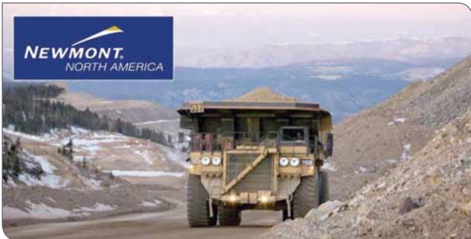
حدود ۷۵۰ دلار برای هر اونس بر تولید خود افزوده، در اکتشافات سرمایه‌گذاری کرده و ترازنامه‌اش را به وضعیت عادی باز گردانده است. گلدبرگ همچنین گفت ۷۰ درصد تولید و ذخایر نیومونت در ایالات متحده و استرالیا است. او گفت: ما ۲ معدن از جدیدترین معدن‌مان به نام‌های مریان (امریکا جنوبی) و لانگ کنیون (نوادا) را به موقع و ۲۰ درصد زیر بوجه ساختم. سال گذشته

شرکت معدنکاری نیومونت ماینینگ، پیش‌بینی می‌کند که تولید طلای مربوط به این شرکت در سال ۲۰۱۹ میلادی (۱۳۹۸ خورشیدی) به ۵.۲ میلیون اونس و در سال ۲۰۲۰ میلادی (۱۳۹۹ خورشیدی) به ۴.۹ میلیون اونس برسد و ۴۵ هزار تن مس در هر یک از ۲ سال یاد شده استحصال کند. به گزارش اخبار فلزات، هزینه‌های کلی نگهدارنده برای هر اونس طلا در سال آینده میلادی (۲۰۱۹) ۹۳۵ دلار آمریکا و در سال ۲۰۲۰ میلادی ۹۷۲ دلار خواهد بود، در حالی که این هزینه‌ها برای هر پوند مس در سال ۲۰۱۹ میلادی به ۲.۴۵ دلار و در سال ۲۰۲۰ میلادی به ۲.۵۵ دلار خواهد رسید. در بلندمدت، تولید طلای مربوط به این شرکت تا سال ۲۰۲۳ میلادی (۱۴۰۲ خورشیدی) بین ۴.۴ میلیون تا ۴.۹ میلیون اونس و هزینه‌های کلی نگهدارنده برای هر اونس از این فلز بین ۸۷۵ دلار تا ۹۷۵ دلار پیش‌بینی می‌شود و پیش‌بینی شرکت برای تولید مس در دوره یاد شده، افزایش بازده به بین ۴۵ هزار تا ۶۵ هزار تن است که علت این رشد تولید، بیشتر به عیارهای بالاتر در معدن بودینگتون آن در استرالیا و غربی بازمی‌گردد. گری گلدبرگ، مدیرعامل نیومونت، در کنفرانسی تلفنی خطاب به تحلیلگران و سرمایه‌گذاران درباره راهنمای تولید و هزینه به‌روز شده، گفت: ما تبدیل فعالیت‌هایمان را از ۶ سال پیش آغاز کردیم. او افزود: این شرکت تمام دارایی‌های غیر اصلی را تبدیل به پول کرده، رشد سودآور را در ۴ منطقه به پیش برده، بیش از ۲ میلیون اونس طلا با هزینه‌های کلی تولید