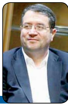
وجود ۴ هزار معدن غیر فعال دارای پروانه در کشور