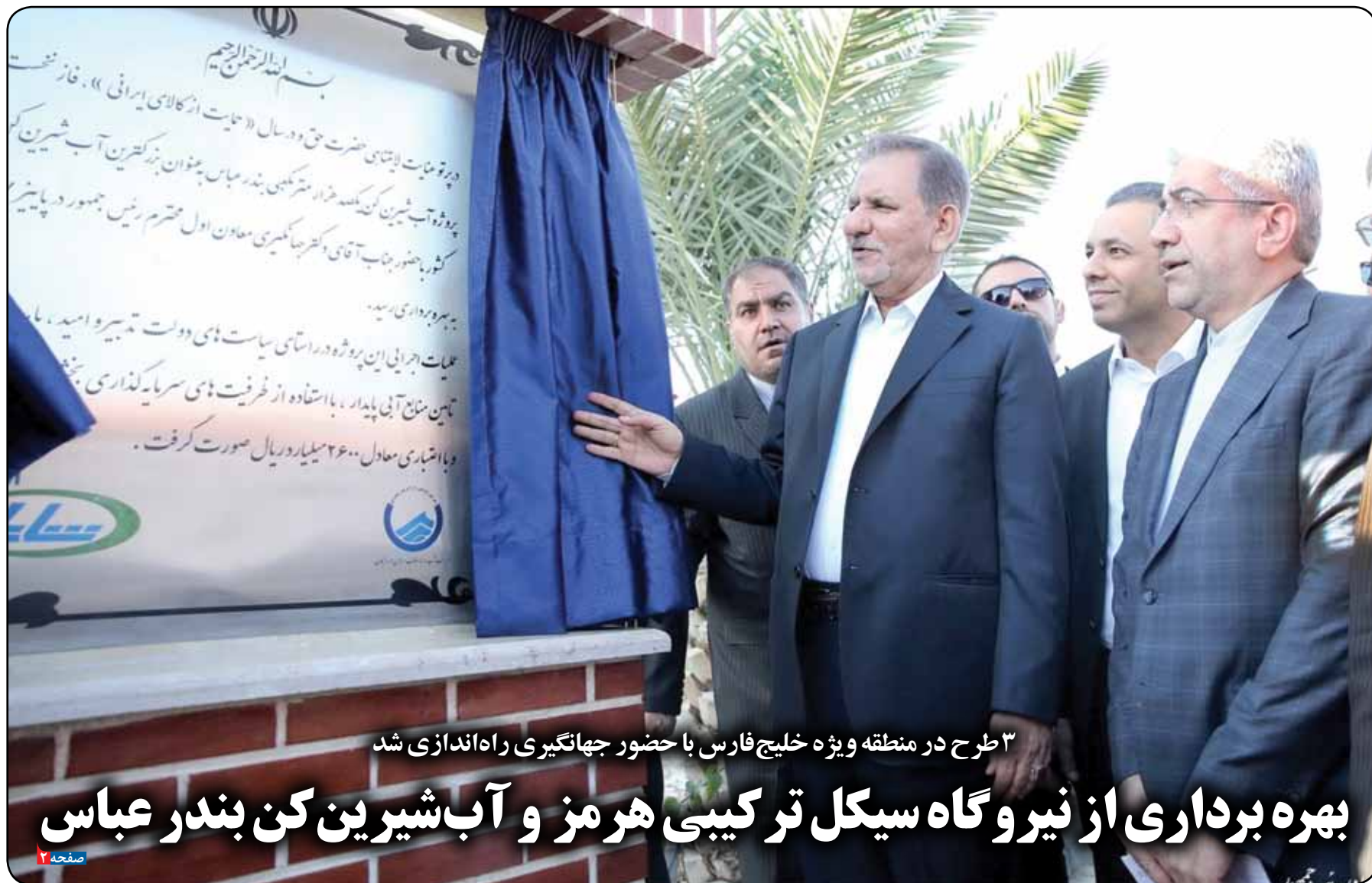
۳ طرح در منطقه ویژه خلیج فارس با حضور جهاتگیری راه‌اندازی شد