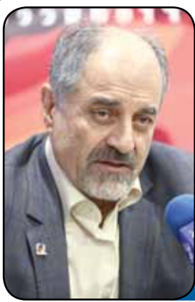
بانک اطلاعاتی فولاد ایجاد می‌شود