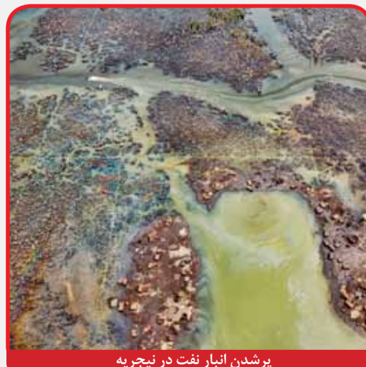
برشدن انبار نفت در نیجریه