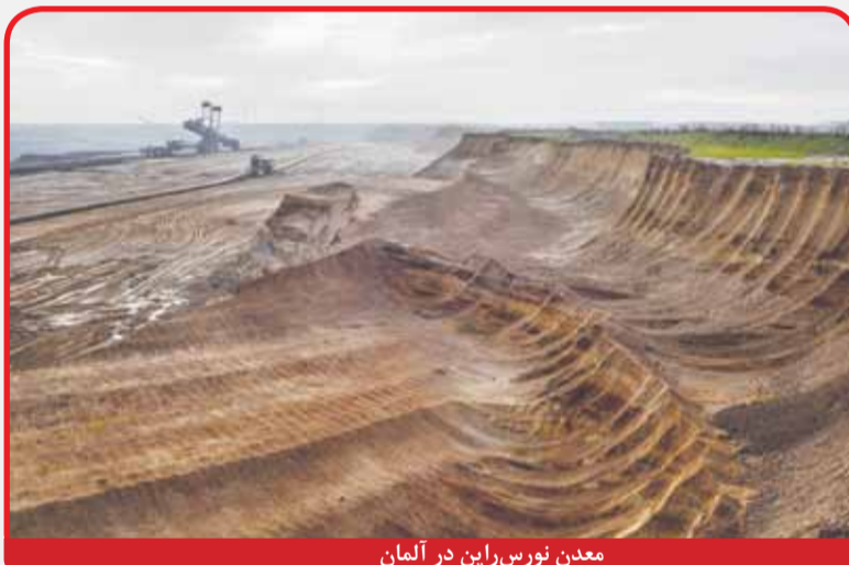
معدن نوریس‌راین در آلمان