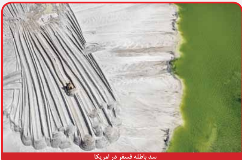
سد باطله فسفر در آمریکا

«دوارد برتسنکی» عکاس کانادایی این تصویرهای هوایی را از استخراج منابع طبیعی در مقیاس بزرگ گرفته و در آنها آثار شهرنشینی و زدایش جنگل‌ها را که برآمده از فعالیت‌های انسان بر سطح زمین است، نشان می‌دهد. بخش چشمگیری از این تاثیرات برآمده از استخراج مواد معدنی است. روزنامه انگلیسی گاردین این تصویرها را در سال گذشته میلادی منتشر کرده است. برگردان: ثمن رحیمی‌راد