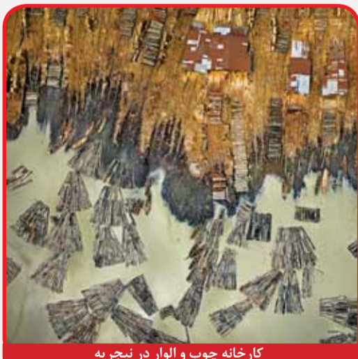
کارخانه چوب و الوار در نیجریه