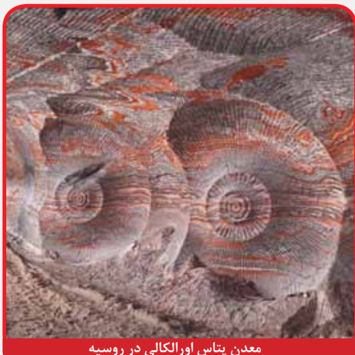
معدن پتاس اورالکالی در روسیه