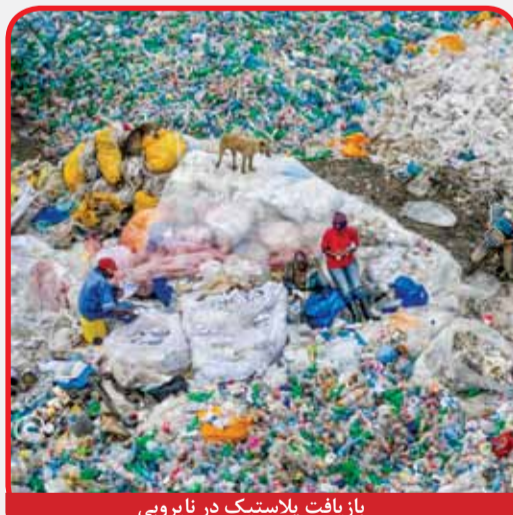
بازیافت پلاستیک در نایروبی