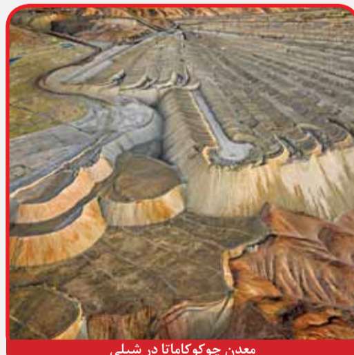
معدن چوکوگاماتا در شیلی