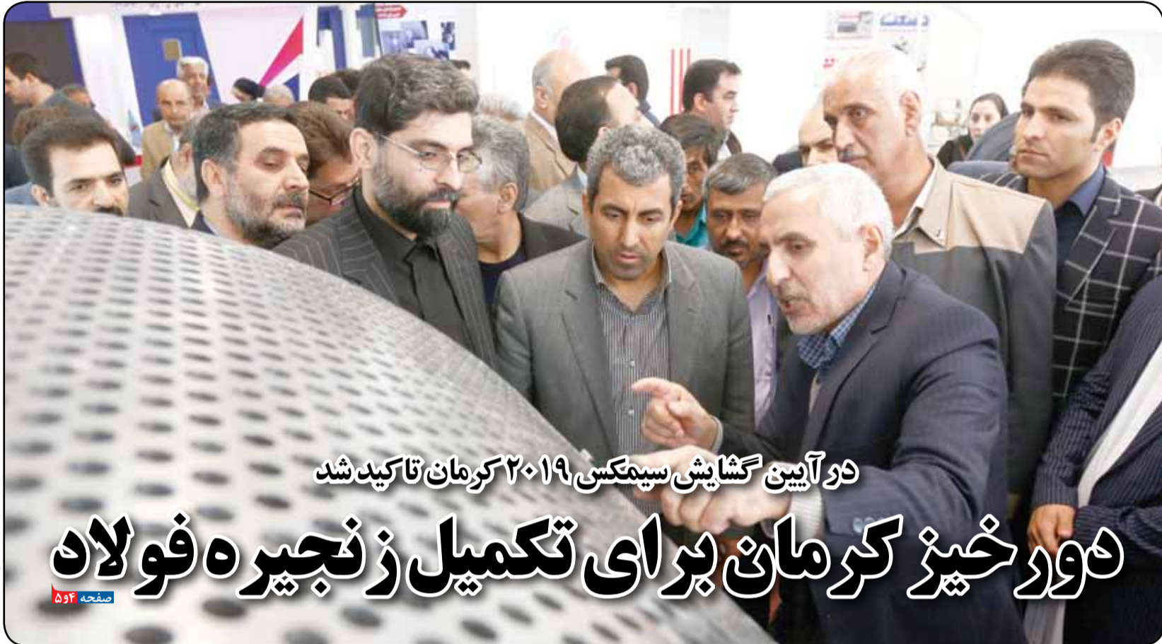
در آیین گشایش سیمکس ۲۰۱۹ کرمان تاکید شد