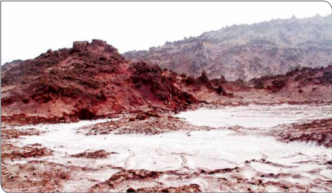
قاچاق خاک معدنی در استان زنجان.

شاید قاچاق رسمی خاک وجود نداشته باشد یا به اندازه‌ای نباشد که بخواهیم راجع به آن صحبت کنیم اما خروج خاک از ایران به‌طور قانونی و با خام‌فروشی مواد معدنی اتفاق می‌افتد. این خاک با نرخ خاک معمولی به فروش می‌رسد