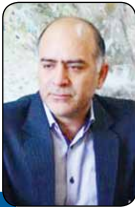
معاون اکتشاف سازمان زمین شناسی بیان کرد: اکتشاف در ۷ درصد مساحت کشور