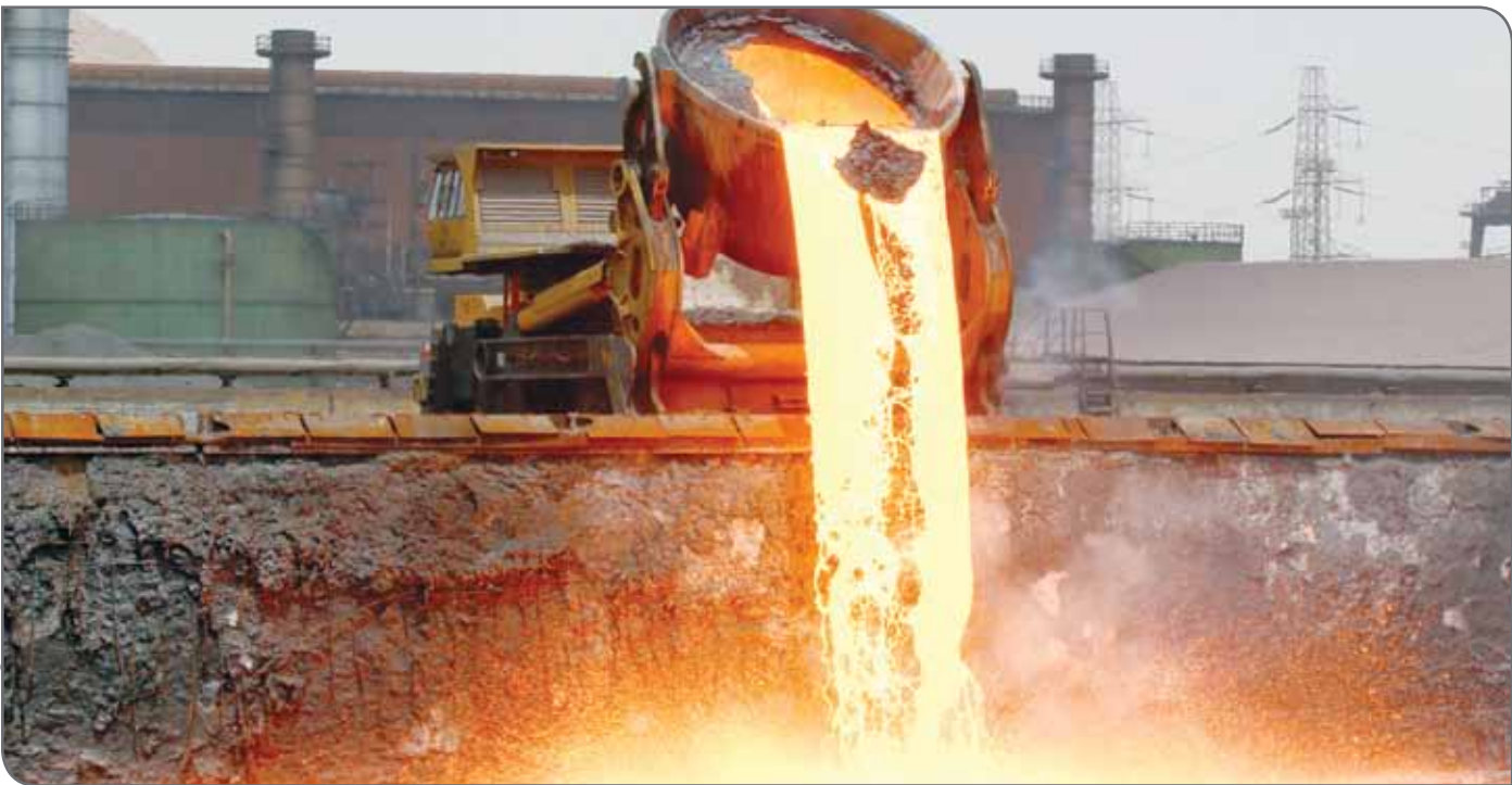
شرکت فولاد مبارکه