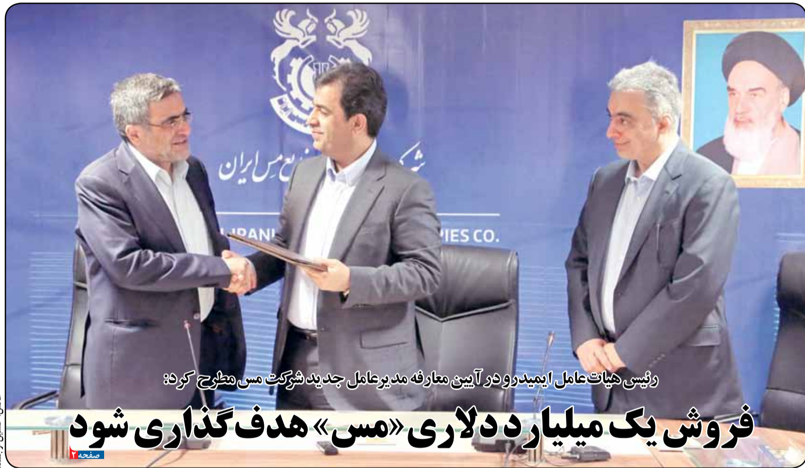
رئیس هیات عامل ایمیدرو در آیین معارفه مدیرعامل جدید شرکت مس مطرح کرد:

دوشنبه ۲۳ اردیبهشت ۱۳۹۸ • ۷ رمضان ۱۴۴۰ • ۱۳ مه ۲۰۱۹ • سال دوم • شماره ۱۶۳ • ۸ صفحه • قیمت ۲۰۰۰ تومان