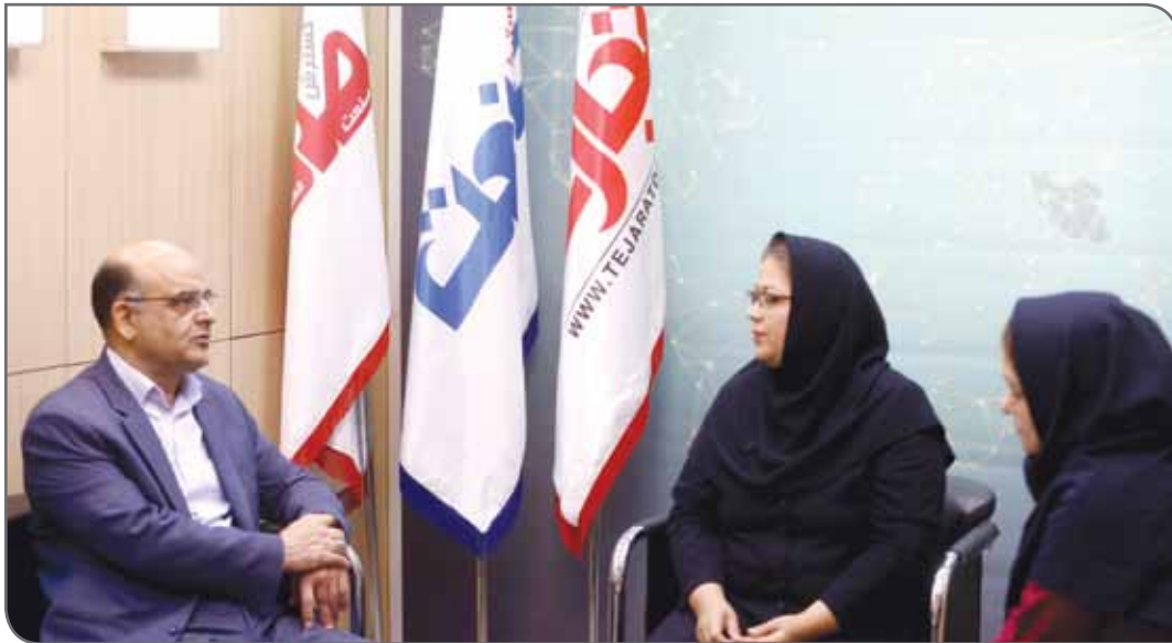
حکیم آبادی فردی

در شرایط سخت باید امیدواری را به همه تسری داد