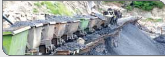
شد. همچنین شرکت‌های زغال سنگ طیس و البرز مرکزی در ماه نخست امسال، ۱۳۱ هزار و ۴۲۲ تن زغال سنگ استخراج کردند که نسبت به رقم

میزان تولید کنسانتره زغال سنگ شرکت‌های طیس و البرز مرکزی (وابسته به ایمیدرو) در نخستین ماه از سال ۹۸، با رشد ۳۳ درصدی روبه‌رو شد.