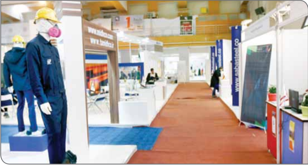
نمایشگاه صنایع معدنی و راهسازی کرمان

وی با اشاره به سطح نمایشگاه کرمان عنوان کرد: نمایشگاه به لحاظ حضور شرکت‌های معدنی در سطح خوبی قرار دارد اما به لحاظ