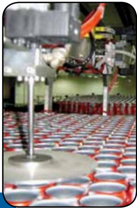
قوطی‌های آلومینیوم نیازمند کویل‌سازی