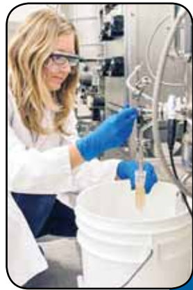
بیولیچینگ به صرفه‌ترین روش فرآوری مواد معدنی