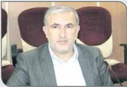
در سطوح ملی و استانی، مجوزهای لازم را اخذ سپس اقدام کنند.

با تأکید بر حفظ محیط‌زیست و اراضی جنگلی در هنگام اکتشافات معدنی استان گفت: ابتدا باید با امکان‌سنجی، مطالعات مورد نیاز اکتشاف را انجام داده و پس از اخذ مجوزهای لازم در اختیار سازمان‌های اجرایی متولی قرار دهند.