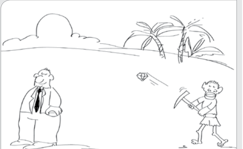
طرح: حسین علیزاده