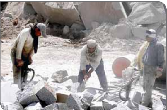
ری با ۷۰ هزار نفر جمعیت در ۳۰ کیلومتری جنوب شهرری و در مسیر جاده قدیم تهران - قم قرار دارد.

عبادتی گفت: ارتفاع پسماندهای سنگبری‌ها به صورت پودر سنگ و گل سنگ (لش آب‌سنگ) گاهی به ۸ متر نیز می‌رسد و این پسماندها در زمان خشک شدن با کوچک‌ترین وزش باد، به کانون گرد و غبار در منطقه تبدیل می‌شوند. وی ادامه داد: گرد و خاک حاصل از پسماند واحدهای سنگبری علاوه بر آلودگی هوا برای ساکنان این منطقه مشکلات فراوانی ایجاد می‌کند. عبادتی با تأکید بر اینکه پسماندهای واحدهای سنگبری باید به شکل درست و اصولی دفن شوند، اضافه کرد: اداره کل حفاظت محیط‌زیست استان تهران در نیمه دوم سال ۹۷ زمینی به مساحت ۷۰ هکتار را برای دفن پسماندهای صنعتی استان تهران در جنوبی‌ترین نقطه استان مشخص کرده است. وی ادامه داد: محل دفن پسماندهای صنعتی استان تهران در ۵ کیلومتری شهرک صنعتی شمس‌آباد جانمایی شده و پسماندهای سنگبری‌ها در این مکان به شکل درست و اصولی با استفاده از فناوری روز دفن خواهند شد. شهرک صنعتی شمس‌آباد با ۲ هزار و ۹۰۰ هکتار مساحت به عنوان بزرگ‌ترین شهرک صنعتی خاورمیانه در ۳۵ کیلومتری جاده تهران قم پس از مرقد مطهر امام خمینی (ره) قرار دارد. حسن‌آباد فشافویه از توابع شهرستان