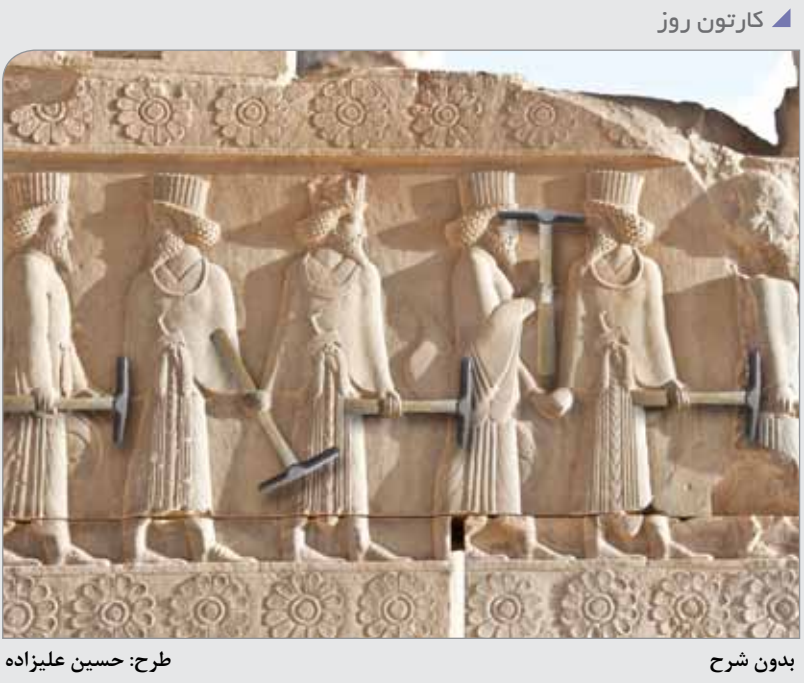
طرح: حسین علیزاده

شاخص دلار نیز در برابر سیدی از ارزهای بزرگ تغییری نداشت. چشم‌انداز کاهش نرخ‌های بهره از سوی بانک مرکزی آمریکا در ماه میلادی جاری این ارز را زیر فشارهای کاهش‌ی قرار داده است. بر اساس گزارش رویترز، طلا ماه گذشته متاثر از انتظارات برای