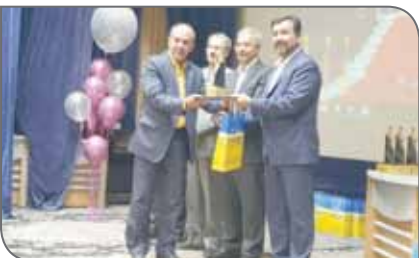
صداوسیما نیز در این آیین درباره روابط عمومی هوشمند سخنرانی کرد.

مدل تعالی سازمانی EFQM یکی است استاندارد اروپایی است که به عنوان ابزاری قوی برای سنجش میزان استقرار شبکه ها در سازمان های مختلف به کار گرفته می شود. معیارهای اصلی انتخاب روابط عمومی سرآمد شامل مخاطب گرایی، مدیریت فرآیندی، مسئولیت اجتماعی، توسعه سطح همکاری و مشارکت با محیط پیرامون، یادگیری و بهبود مستمر، تجهیز و نوسازی منابع انسانی، نتیجه گرایی و رهبری و مدیریت بودند. در این همایش، یصاد مرحوم هوشنگ عباس زاده، استاد پیشکسوت روابط عمومی گرامی داشته شد و از سوی روابط عمومی ذوب آهن هدیه ای به رسم یادبود به خانواده ایشان تقدیم شد. دکتر دارابی، مدیر کل استان های سازمان