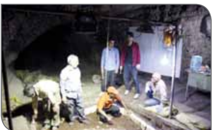
هزار سال پیش دارد که این محوطه را به یکی از سایت‌های کلیدی ایران تبدیل کرده است.

که پس از پایان مطالعات، نتایج آنها در قالب مقالات علمی، سخنرانی‌ها و... به اطلاع مجامع علمی و عموم کشور خواهد رسید. این باستان‌شناس با بیان اینکه سومین فصل کاوش باستان‌شناسی غار کلدنر لرستان با مجوز پژوهشگاه میراث فرهنگی و گردشگری انجام شد، اضافه کرد: این محوطه که هم‌اکنون به‌عنوان قدیمی‌ترین سایت پارینه‌سنگی جدید در ایران شناخته شده دارای شواهد پارینه‌سنگی میانه در لایه‌های زیرین است.