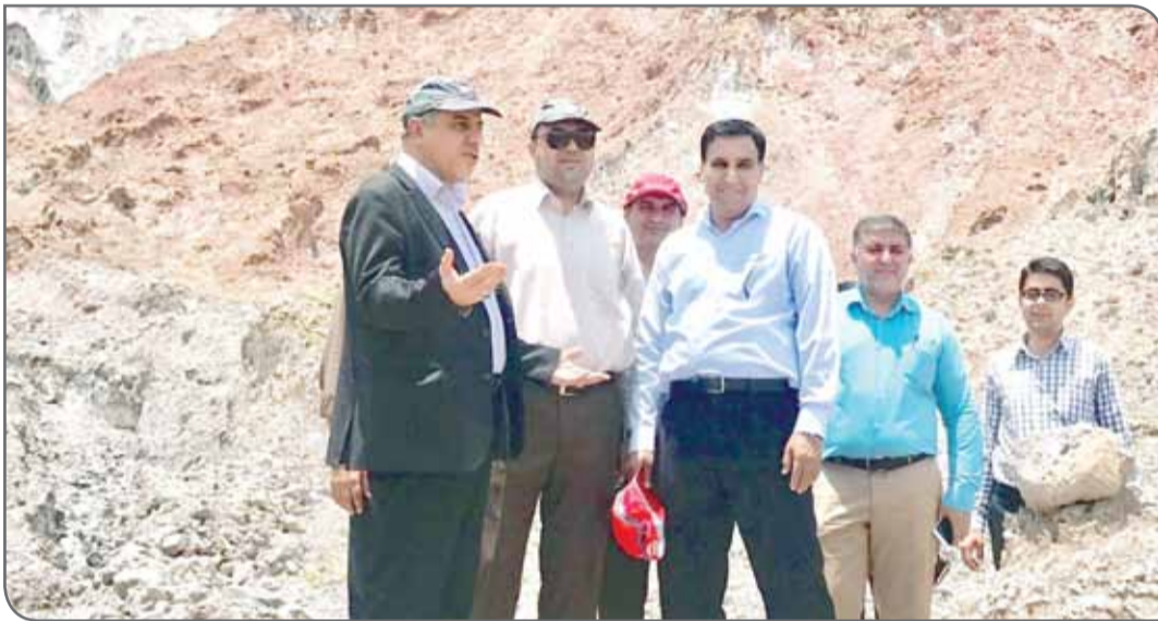
یازدهم مسئولان استان هرمزگان در محدوده اکتشافی بستک

گفتنی است با توجه به اختلاف مطرح شده درباره محدوده اكتشافی گنبد نمکی شهرستان بستک و تصاویر منتشر شده در فضای مجازی، ایرج حیدری، معاون هماهنگی و امور اقتصادی استانداری هرمزگان به همراه رئیس سازمان صنعت، معدن و تجارت هرمزگان و مدیران اداره كل میراث فرهنگی و اداره كل منابع طبیعی هرمزگان، از محدوده اكتشافی گنبد نمکی روستای فتویه شهرستان بستک دیدار كردند.