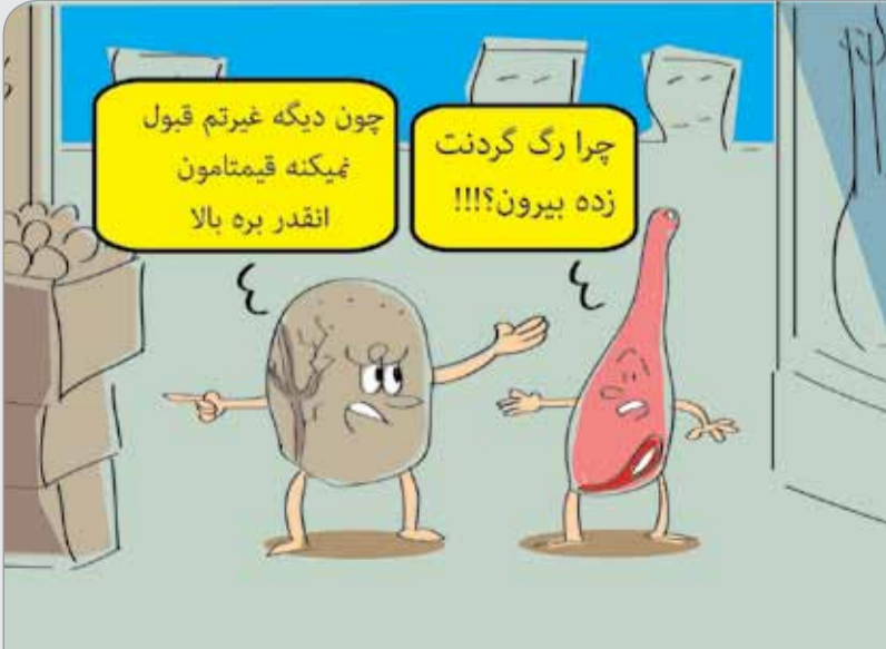
طرح: حسین علیزاده