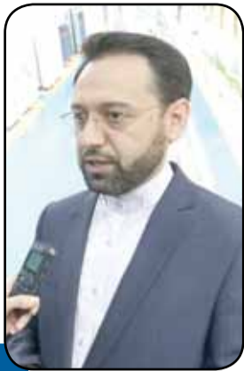
افزایش تولید کلید رشد صادرات سنگ