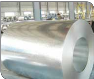
میلادی و بیش از ۵۳ درصدی نسبت به برنامه تولید جهانی است. براساس مطالعات شرکت ام‌ای‌پی‌اس

روند بهبود نیافته است. بنابراین پیش‌بینی می‌شود تولید این محصول در ژاپن در سال ۲۰۱۹ میلادی به ۳ میلیون و ۱۲۵ هزار تن کاهش یابد که حاکی از افت ۴۸ درصدی نسبت به سال پیش از آن خواهد بود. در سال جاری میلادی تولید فولاد زنگ‌نزن در تایوان نیز به یک میلیون و ۱۷۵ هزار تن کاهش خواهد یافت و همچنین کره جنوبی با تولید ۲ میلیون و ۴۲۵ هزار تن، تولیدی مشابه سال گذشته میلادی به ثبت می‌رساند.