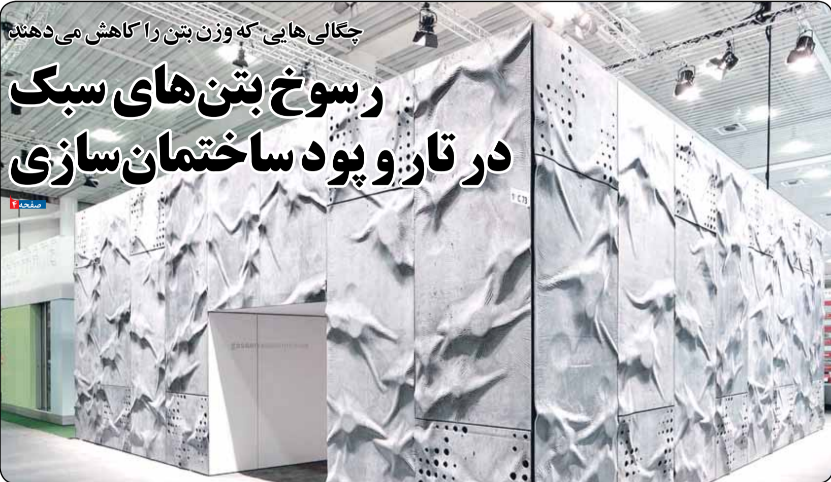
چگالی‌هایی که وزن بتن را کاهش می‌دهند