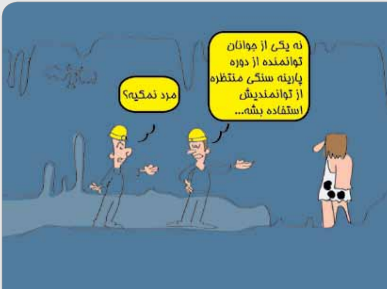
مطبوعات: از ظرفیت جوانان توانمند در بخش معدن استفاده شود