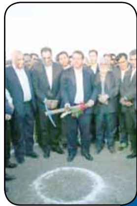
کلنگ‌زنی شهرک صنعتی مس در ورزقان و تولید میلگرد آجدار