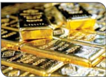
چین روی داد، جنگ تجاری میان دو کشور را تشدید خواهد کرد.

در نظرسنجی کیتکونیوز از کارشناسان وال‌استریت، ۴ نفر شرکت کردند که از میان آنها، ۱۳ نفر یا ۹۳ درصد افزایش نرخ طلا و تنها یک نفر یا معادل ۷ درصد کاهش نرخ طلا را پیش‌بینی کردند و در این نظرسنجی کسی نظر خنثی نداشت.