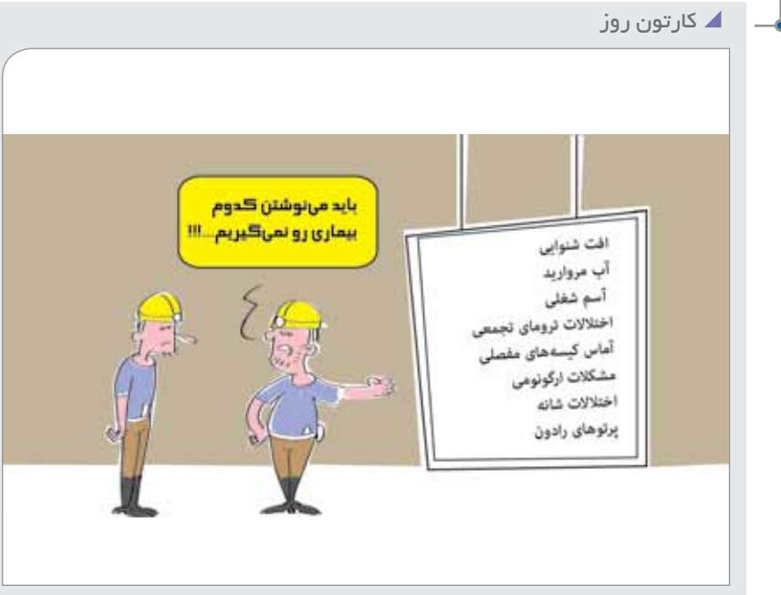
در حاشیه بیماری‌های شغلی کارگران معدن