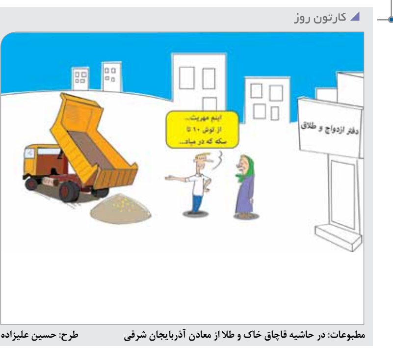
طرح: حسین عزیزاده

هزینه بالای تولید انرژی در این کارخانه‌ها خواهد بود. زغال سنگ تا قبل از دهه گذشته که وارد رقابت با بازار گاز شود، جلودار صنعت انرژی در آمریکا بود. در سال ۲۰۱۶ میلادی (۱۳۹۵ خورشیدی) و با توسعه نفت شل، گاز طبیعی به عنوان منبع تولید انرژی تمیز تر زغال سنگ را پشت سر گذاشت. اما در دو سال گذشته بازاران و به‌صرفه‌تر شدن تولید انرژی به‌وسیله نیروهای بادی و خورشیدی این منابع جایگزین سوخت‌های فسیلی شدند. نگرانی از تغییرات آب و هوایی نیز خانواده‌ها و مشاغل را به استفاده بیشتر از انرژی‌های پاک ترغیب و این امر صنعت زغال سنگ آمریکا را دچار چالش اقتصادی گسترده‌تری کرد. دولت آمریکا زیر فشار مردم اهداف بلندپروازانه برای این صنعت در نظر گرفت و آن را به عنوان منبع ایجاد شغل تأیید کرد. هفته گذشته فرماندار نیومکزیکو اعلام کرد تا سال ۲۰۳۰ میلادی (۱۴۰۹ خورشیدی) نیمی از انرژی مورد نیاز این منطقه به‌وسیله انرژی پاک تأمین خواهد شد ضمن اینکه تا سال ۲۰۴۵ میلادی (۱۴۲۴ خورشیدی) تمام نیروگاه‌های تولید انرژی عاری از کربن خواهند بود. نشانه‌ها حاکی از تغییر جهت نیروگاه‌های تولید انرژی به سمت انرژی پاک است.