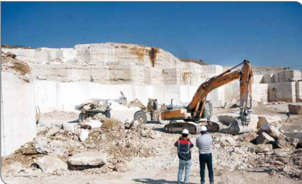
صحنه‌ای از معدن کاپور

با نیاز به یک ریز پایدار محیطی، منجر به توسعه روش‌های پیشرفته استخراج می‌شود. در سراسر جهان، بیشتر ذخایر معدنی سطحی باکیفیت بالا، شناسایی شده و توسعه‌یافته‌اند و نیازمند فناوری‌های جدید برای شناسایی ذخایر زیر پوشش هستند. افزایش نگرانی اجتماعی درباره معدن باعث می‌شود فرآیندها و فناوری‌های جدید توسعه یابند و در نتیجه، وضعیت اجتماعی، عملکرد زیست‌محیطی و رونق اقتصادی نیز بهبود یابد.