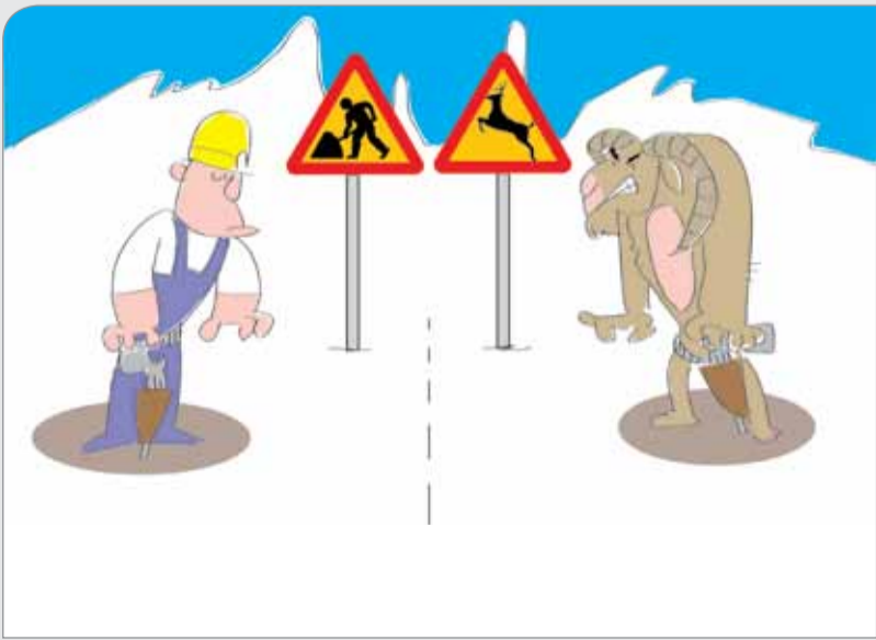
طرح: حسین علیزاده