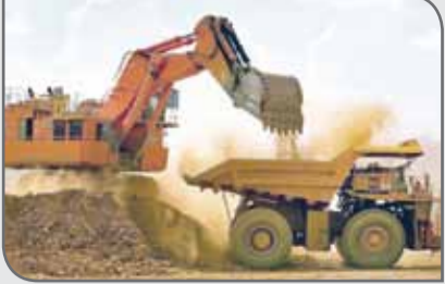
بین بانکی، به بهره‌برداران و استخراج‌کنندگان معدنی ارائه می‌شود.

طرح‌های مرتبط با عملیات معدنی امضا شد. اکتشاف و دسترسی آسان به منابع مالی بانک‌ها مدیرعامل صندوق بیمه سرمایه‌گذاری فعالیت‌های معدنی گفت: از دیگر خدمات صندوق، می‌توان به اکتشاف اشاره کرد که از منابع مالی تامین شده از جوه اداره شده وزارت صنعت، معدن و تجارت است. وی افزود: این رویه، نرخ تامین مالی را کاهش خواهد داد. به این منظور بیمه‌نامه اعتباری بهره‌برداری نیز برای دسترسی آسان به منابع مالی بانکی و