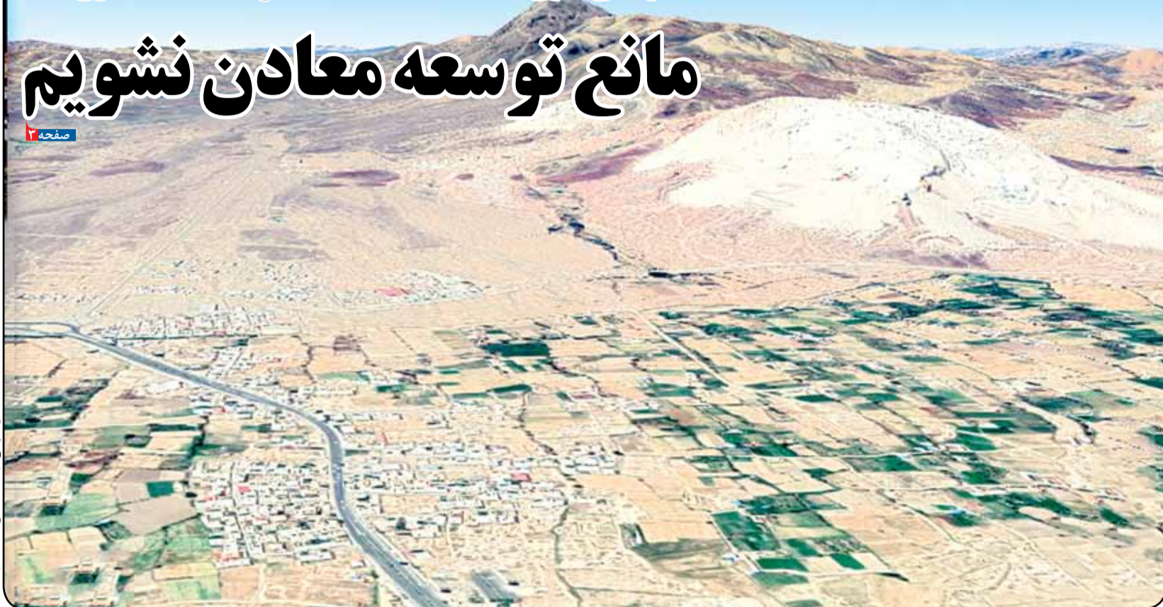
نمای هوایی از یک معدن سنگ در محلات