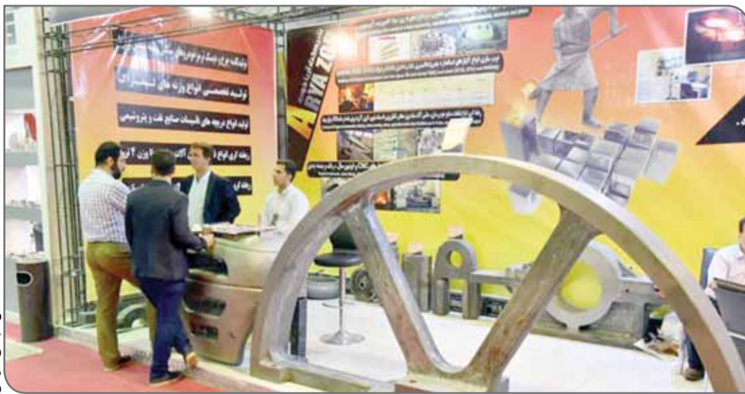
پایه نمایشگاهی کاتدی

این کارشناس در ادامه به اهمیت اطلاع‌رسانی در برپایی نمایشگاه‌ها پرداخت و گفت: مسئله‌ای که در نمایشگاه‌های شهرستان‌ها از جمله نمایشگاه‌های اصفهان وجود دارد، ضعف در اطلاع‌رسانی و تبلیغ برپایی رویداد است. این ضعف در تهران کمتر به چشم می‌خورد و اطلاع‌رسانی با قوت بیشتری انجام می‌شود اما در شهرستان‌ها این‌طور نیست.