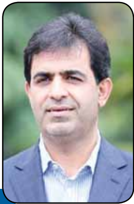
ورود دولت به بهره‌برداری از معادن سنگ آهن هماتیته