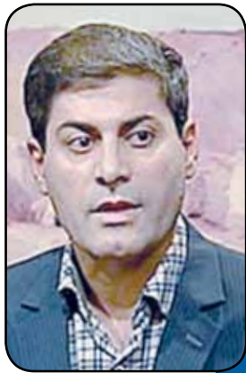
حرکت به سمت اکتشاف عمقی