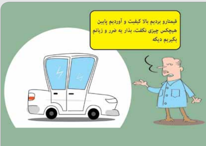
مطبوعات: انجمن خودروسازان با انتقاد از سرکوب قیمتی در خصوص خودروهایی تولیدی خواستار پرداخت کمک زیان به خودروسازان شد