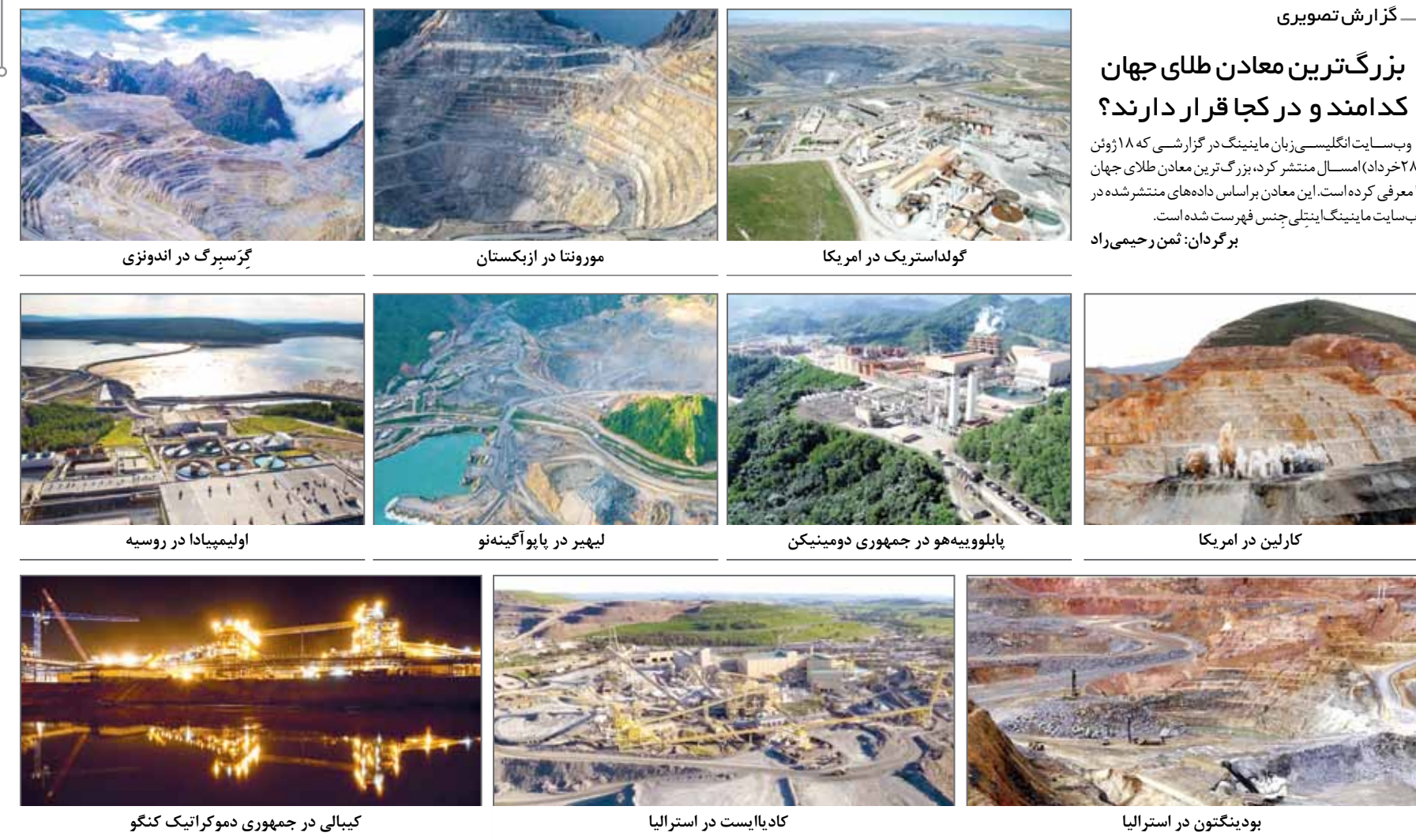
گولداستریک در امریکا | موروئا در ازبکستان | گزسپرگ در اندونزی | کارلین در امریکا | پابلووییه‌هو در جمهوری دومینیکن | کادایایست در استرالیا | کیبالا در جمهوری دموکراتیک کنگو | اولیمپیدا در روسیه | لیپهر در پاپوآ نیو گینه