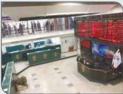
کوشک کمک کند.

بر اساس این گزارش محموله هزار تنی زغال سنگ حرارتی شرکت طیس احیاسپهان به نرخ هر کیلوگرم ۴۸۰۰ ریال روی رینگ داخلی بورس انرژی رفت. پس از این عرضه، محموله هزار تنی زغال سنگ کک شوش شرکت طیس احیاسپهان به نرخ هر کیلوگرم ۴۵۰۰ ریال عرضه شد. گفتنی است زمان تحویل هر ۲ محموله یاد شده ۷ مهر سال جاری از در کارخانه اعلام شده و شرایط پرداخت نیز به طور نقدی به انضمام واریز ۱۰ درصد ارزش معامله، نیم ساعت پیش از آغاز عرضه به حساب شرکت سپرده گذاری مرکزی عنوان شده است.