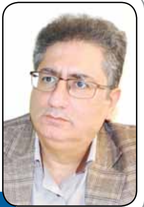
ایمان انتظام: بارندگی‌ها نتوانست برداشت بی‌رویه از آب‌های استاتیک را جبران کند