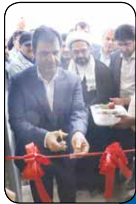
راه اندازی واحد فولادسازی شادگان از شهریور ۹۹