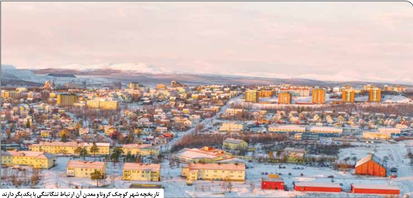
تاریخچه شهر کوچک کرونا و معدن آن ارتباط تنگاتنگی با یکدیگر دارند