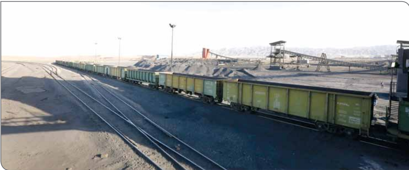
معدن مس سرچشمه

خود به ارز نیاز دارند مجبور هستند برای تأمین نیاز خود چنین کاری کنند. او تأکید کرد: در واقع مواد معدنی مشابه نفت هستند، همان‌قدر که نیاز داریم نفت صادر کنیم به همان نسبت هم به صادرات مواد معدنی نیاز داریم و هر چه بیشتر از خام‌فروشی دوری کنیم به سود اقتصاد کشور است.