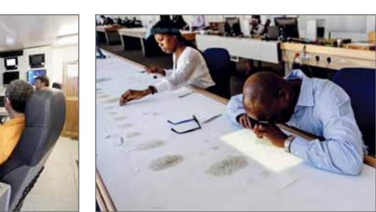
سنگ‌های قیمتی هستند، در بستر اقیانوس جست‌وجو کنند و بیرون بکشند. این کشتی‌های غول پیکر در جریان یک سرمایه‌گذاری مشترک به نام «دب‌مارین نامیبیا» برای دستیابی به این ذخایر به کار گرفته شده‌اند و این سرمایه‌گذاری بین دولت نامیبیا و شرکت انگلیسی دی‌پرز انجام شده است. دی‌پرز از غول‌های استخراج الماس جهان به‌شمار می‌آید. این تصویرها را شبکه تلویزیونی سی‌ان‌ان در وب‌سایت خود از این پروژه منتشر کرده است. تاریخ انتشار ۴ سپتامبر ۲۰۱۸ (۱۶ شهریور ۱۳۹۷) است.