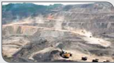
۳ هزار و ۲۱۲ میلیارد ریال در استان مرکزی فعالیت می‌کنند.

کوارتز، اریمان (سولفور آرسنیک)، بنتونیت و کلسیت در منطقه وجود دارد. وی بیان کرد: معادن کانون‌محوری در حوزه کسب و کار و درآمدزایی و پیشبرد امور توسعه پایدار است که باید سهم آنها در حوزه تولید و بالابردن درآمد ناخالص ملی به خوبی دیده شود. ۵۵۶ معدن دارای پروانه بهره‌برداری با ظرفیت استخراج ۲۵ میلیون تن و ذخیره قطعی هزار و ۳۳۸ میلیون تن با اشتغال ۴ هزار و ۲۷۵ نفر و سرمایه‌گذاری