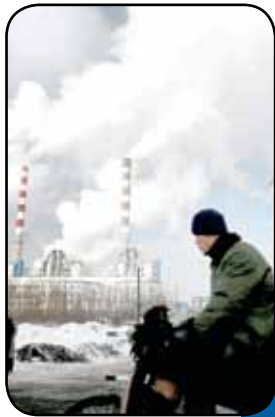
زغال سنگ همچنان سوخت محبوب چین