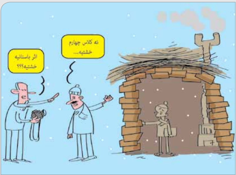
مطبوعات: بیش از هزار کلاس درس خشتی و گلی در کشور وجود دارد. طرح: حسین علیزاده