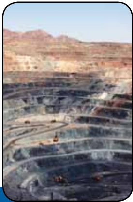
نگاه میان مدت غول های آهنی کشور به بازار