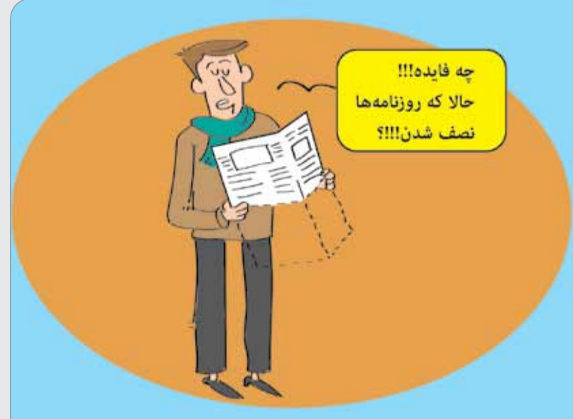
طرح: حسین علیزاده