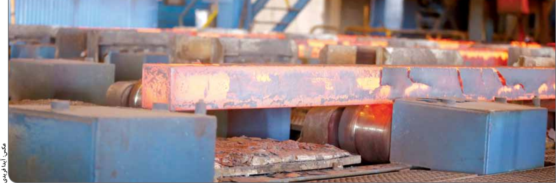
تکمیل: آیدان فریدی