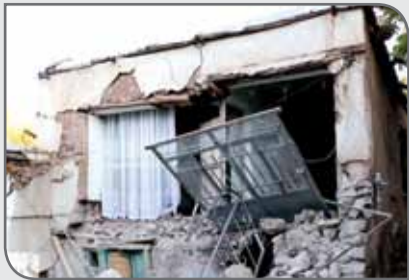
۴۰ روستای شهرستان میانه و ۶۰۰ خانه در ۲۰ روستای شهرستان سراب در این حادثه تخریب شده‌اند.

برگزار شده است، عنوان کرد: هدف از این دوره آشنایی هرچه بیشتر ناظران فنی روستایی با روش‌های نوین مقاوم‌سازی و بالا بردن کیفیت ابنیه در مناطق روستایی است. شامگاه پنجشنبه ۱۶ آبان زلزله‌ای به بزرگی ۵.۹ در مقیاس امواج درونی زمین (ریشتر) ساعت ۲ و ۱۷ دقیقه و ۳ ثانیه بامداد حوالی شهر ترک در استان آذربایجان شرقی را لرزاند. گفتنی است یک هزار و ۷۰۰ واحد مسکونی در