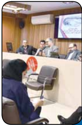
موازی‌کاری نتیجه کار را ضایع می‌کند