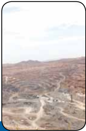
گل‌گهر شتاب می‌گیرد