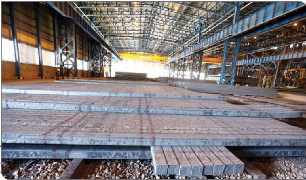
بزرگ‌ترین تولیدکنندگان فولاد جهان

فراهم کنند و در این راستا از قوانین دست و پاگیر بپرهیزند. از سوی دیگر دولت در راستای مشوق‌های صادراتی می‌تواند یارانه‌هایی برای حضور شرکت‌ها در این نمایشگاه‌ها در نظر بگیرد. این در حالی است که دولت ایران هیچ گونه کمک مالی برای حضور شرکت‌ها در نمایشگاه‌ها نمی‌کند و شرکت‌ها با هزینه‌های خود در این نمایشگاه حضور می‌یابند. به تدریج با جا افتادن محصول باکیفیت مشتری‌ها خود طالب کالا می‌شوند و دیگر نیازی به حمایت آنچنانی دولت نیز نخواهد بود اما در ابتدا برای ورود به بازار، حمایت دولت ضروری است. دولت باید یکی مشوق‌های صادراتی بیشتری را در نظر بگیرد و از سوی دیگر زمینه نقل و انتقال ارز را مهیا کند.