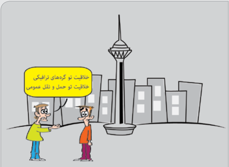
مطبوعات: تهران ۲ سال است که در بین ۵۰ شهر خلاق دنیا است. طرح: حسین علیزاده