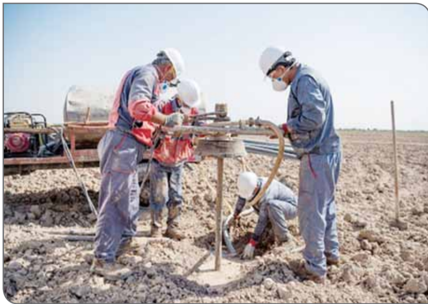
وی اظهار کرد: به منظور انجام مطالعات اکتشافی بر مبنای داده‌های لرزه‌نگاری سه‌بعدی برداشت شده در حوضه رسوبی دزفول شمالی، قرارداد پروژه‌ای برداشتی با مشارکت پیمانکار